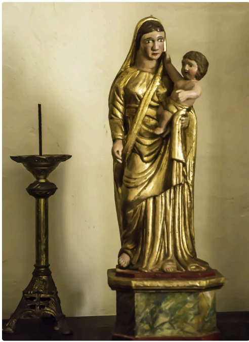
Statuette ancienne qui était noire avant nettoyage...