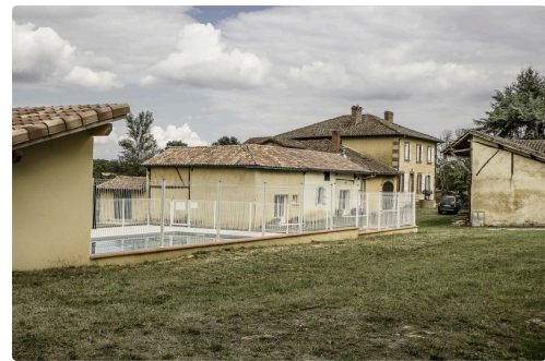
Le site du relais du Haget