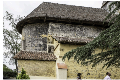
L'arrière de l'église inscrite aux Monuments historiques à cause de son mur en terre