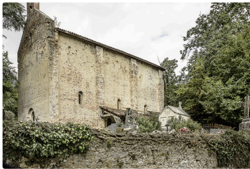
La chapelle de l'hôpital de la Commanderie de l'Ordre de Malte