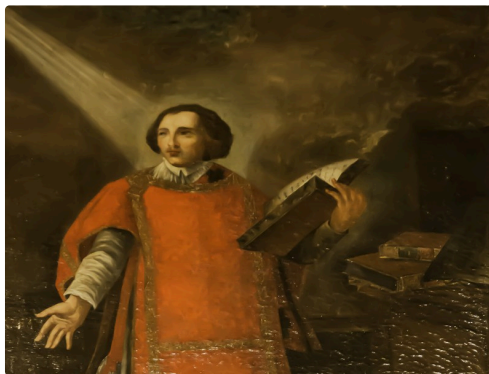
Portrait de saint Vincent