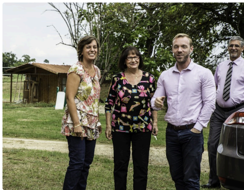
Au Relais du haget