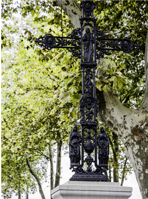
Le calvaire sur la place