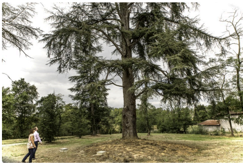
Le cèdre où la propriétaire souhaite installer une cabane en hauteur