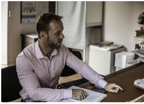
Le sous-préfet Jean-Charles Jobart à la mairie de Cravencères