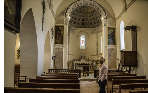
6 Visite de l'église 1bis 200916.jpg