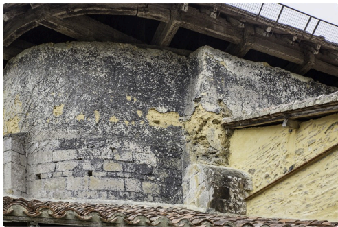
On voit le mur de terre au-dessus des pierres