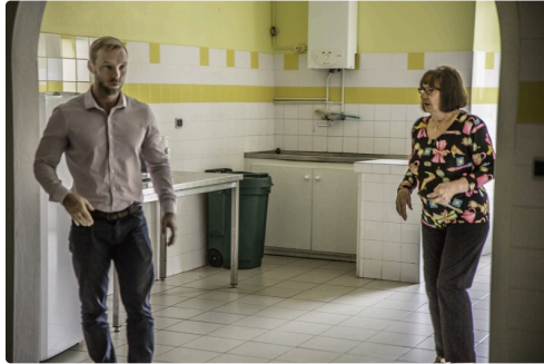
Dans la cuisine de la salle des fêtes