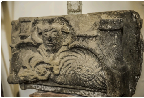
Bloc sculpté trouvé à proximité