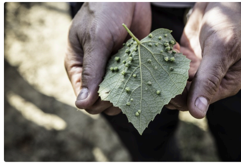
La galle du phylloxéra (excroissances produites par les piqûres)