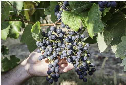
Idem en gros plan