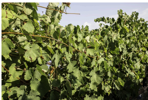
Exemple de longue liane