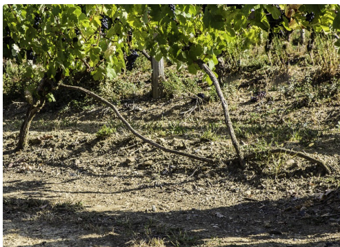
Bel exemple de marcottage