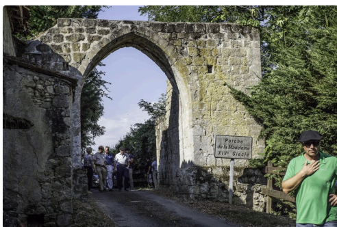
Porche du village de La Madeleine (emblème du vignoble de même nom)