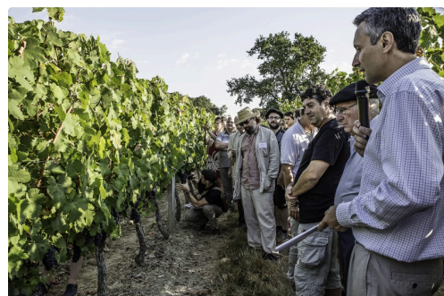
Spécialistes et journalistes sont à l'écoute

Quelques liens de parenté entre les cépages de Saint Mont (d'après Thierry Lacombe - 2012)