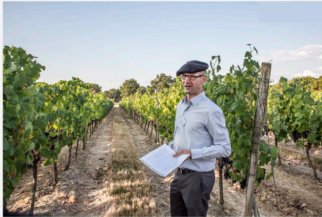
Vins de Saint Mont - Grâce à l'ampélographie, Plaimont développe des cépages oubliés

Qui promettent l'adaptation aux changements climatiques etc.