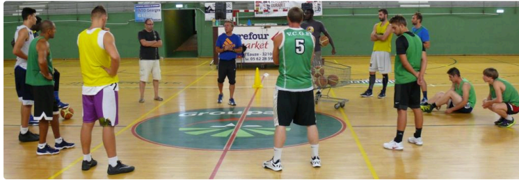
Basket-ball, nationale 2 masculins : Valence-Condom reçoit Garonne ASPPT Basket

Premier match de la saison pour le VCGB qui déjà affronte un cadreur de la poule