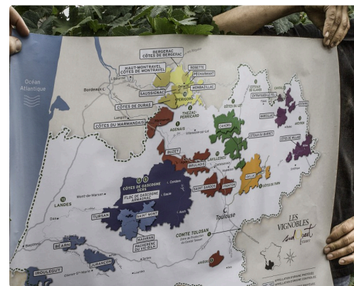
Éric Fitan déploie la carte des vins Sud Ouest France où l'on voit que le vignoble suit le chemin de Saint-Jacques-de-Compostelle