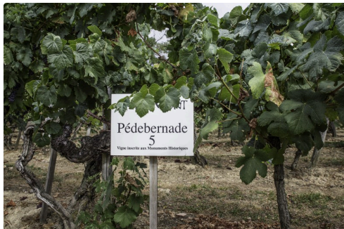
Deux autres pieds conduits sur hautain