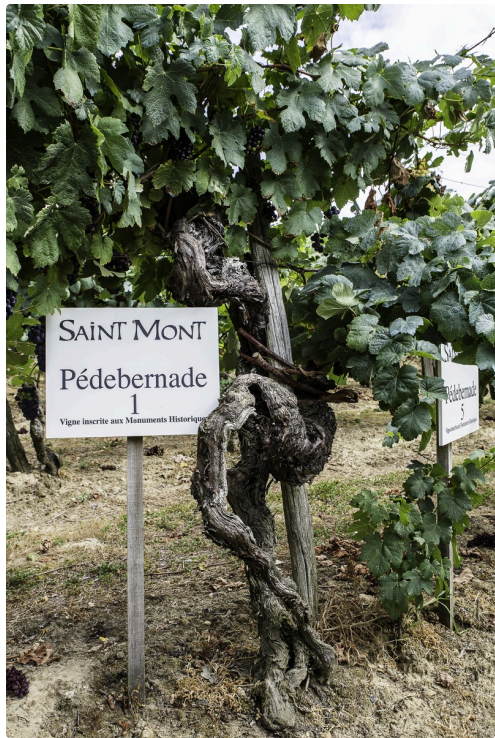
Un pied conduit sur hautain