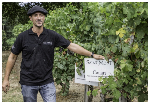
Un des cépages retrouvés