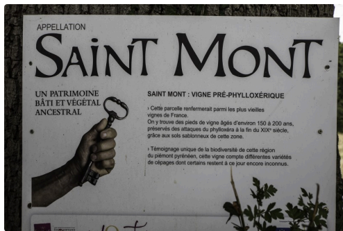
Panneau de la vigne pré-phylloxérique