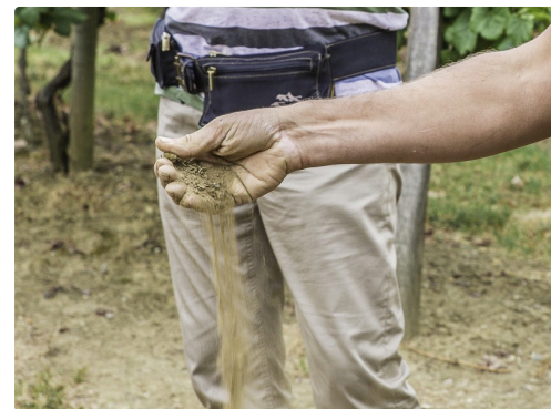
Il montre la texture sableuse du terrain