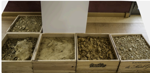
Les terrains du Saint Mont