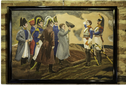
Copie de tableau par Jean Fléveau avec Napoléon et sa suite