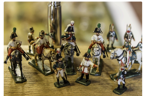
L'état-major russe avec le tsar et le maréchal Koutouзов