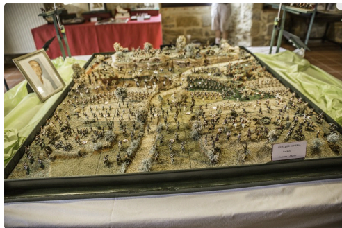
Vue d'ensemble de la maquette avec ses centaines de figurines