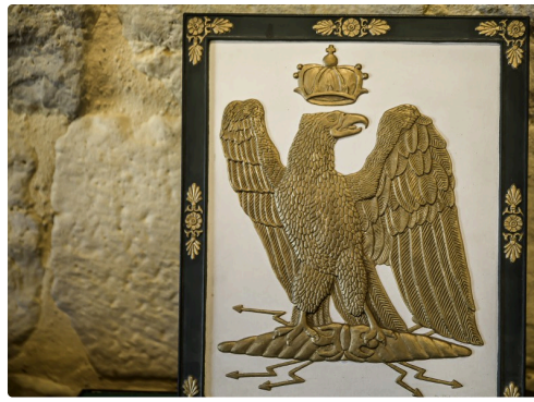
L'aigle en relief, œuvre de Jean Fléveau