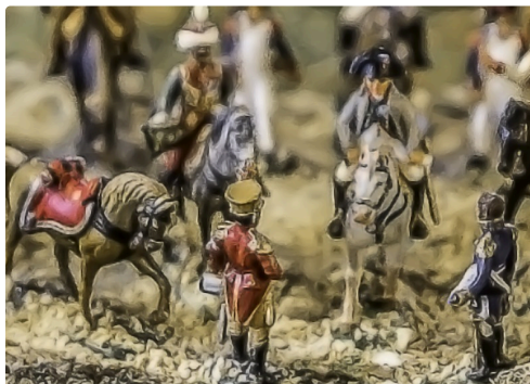
On aperçoit Napoléon dans le flou...