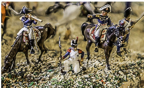
Maréchaux de Napoléon