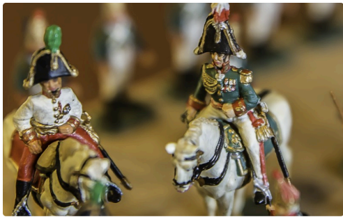
On peut distinguer les décorations du maréchal Koutousov