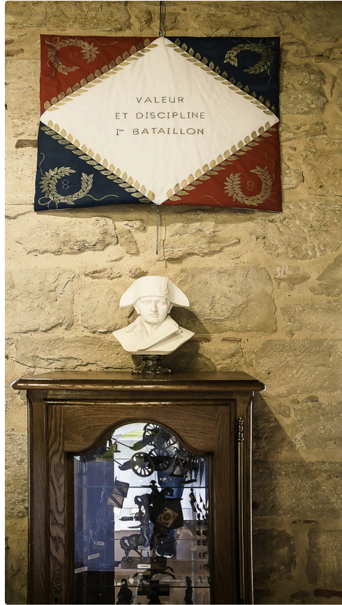
Drapeau d'un régiment britannique et armoire aux trésors napoléoniens