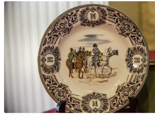
Assiette avec Napoléon et sa suite