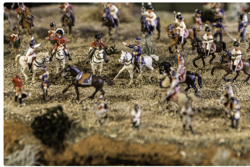
Etats-majors anglais et prussien