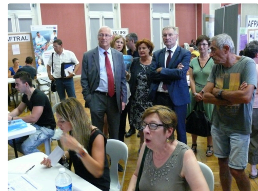
Les personnalités visitent les stands.