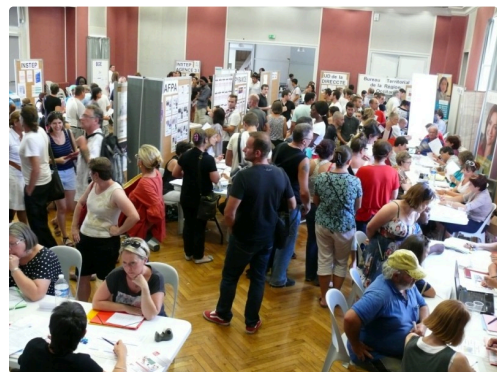
Beaucoup de personnes sont venues aux cordeliers pour trouver un stage de formation.

Et pour ceux qui n'ont pas pu venir à cette offre publique de formation, Pôle emploi reste à leur disposition pour leur donner tous les renseignements afin d'y accéder.