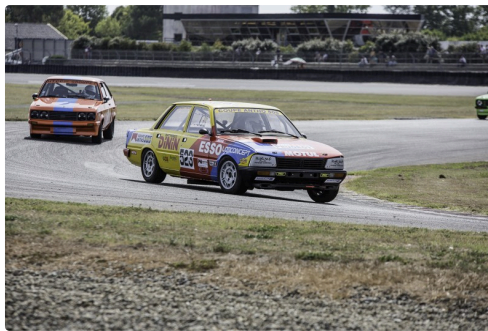
Course 2 HTCC