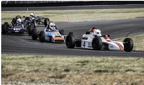
Ford Historic course 2