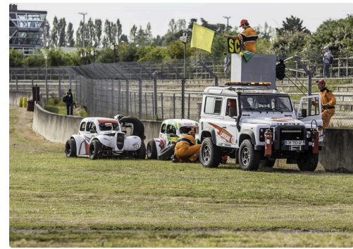
2 Legends Cars sorties de la piste