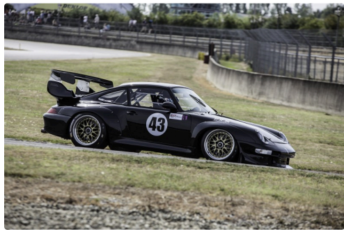
Numéro 43 GT Classic Course 2