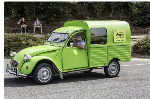
Christian Tison, collectionneur de 2CV, s'en va à la parade sur la piste