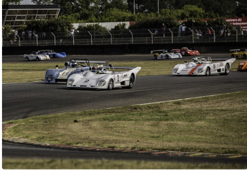
Sport Proto Cupcourse 2