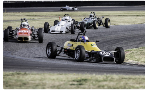
Ford Historic course 2