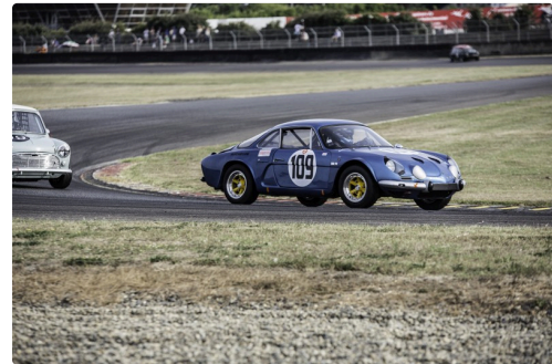
...et se fait doubler par le n°109