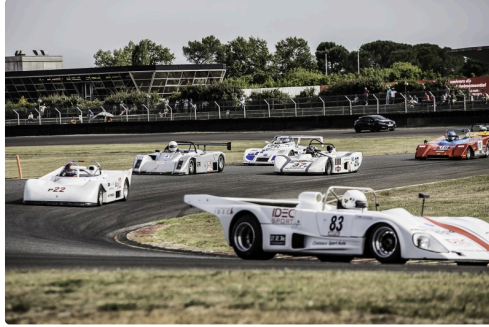
Sport Proto Cupcourse 2