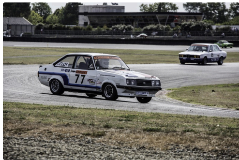
Course 2 HTCC