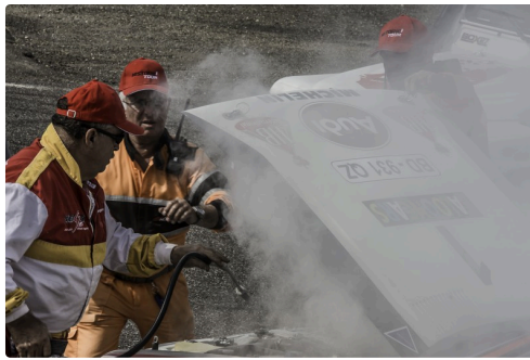
Les commissaires éteignent le feu dans le n°1 des Saloon Cars (rupture de turbo)