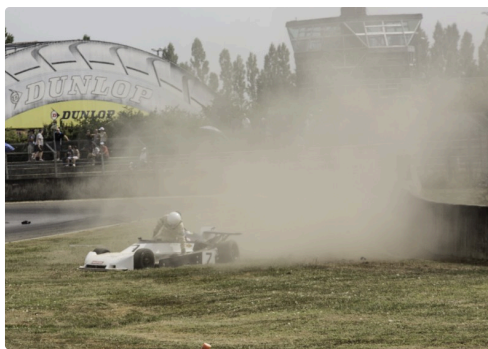
Sortie de piste du n°7 F3 Classic course 2