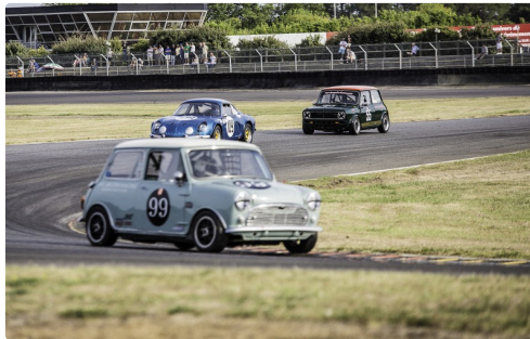
Le n°99 est en tête au début de la course 2 Maxi 1000...