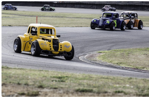
Legends car cup : course d'endurance