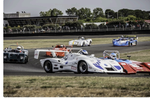
Sport Proto Cupcourse 2