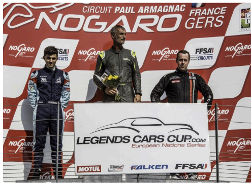
Podium des Legends car cup