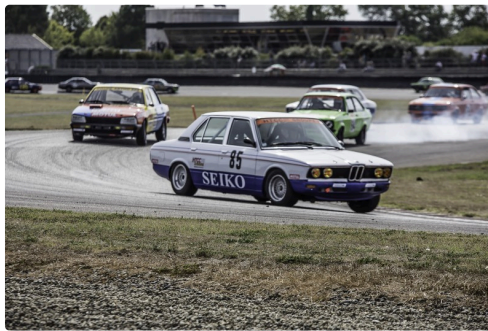
Course 2 Saloon cars et GT tourisme Asavé