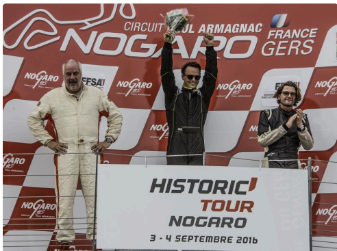
Podium des maxi 1000 course 2