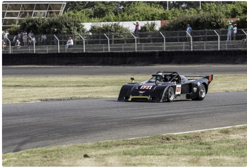
Sport Proto Cupcourse 2