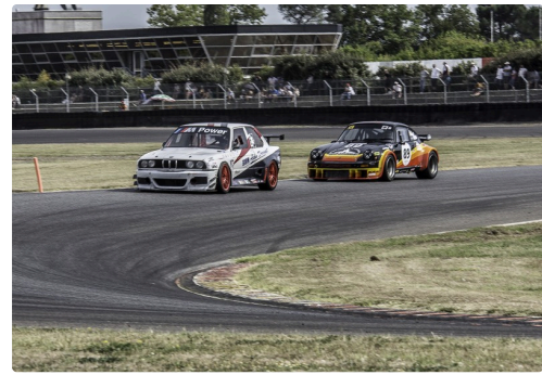
Saloon Cars course 2