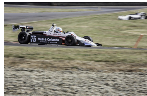
F Classic course 2