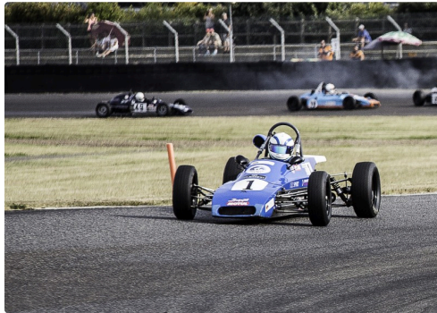
Ford Historic course 2