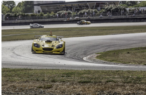
GT Classic Course 2