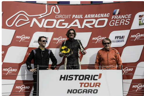
Podium Maxi 1000 Course 1