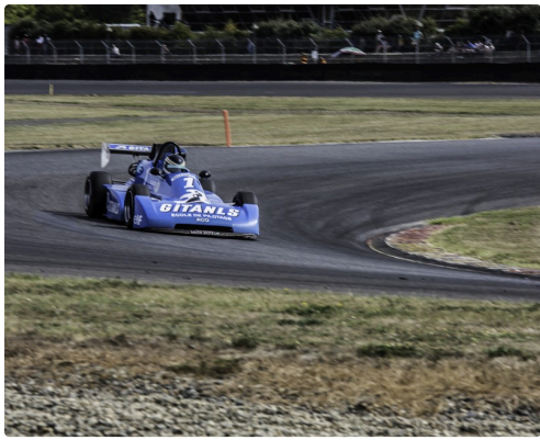
F Classic course 2