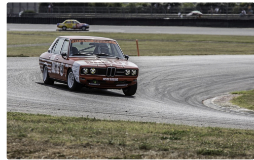
Course 2 Saloon cars et GT tourisme Asavé