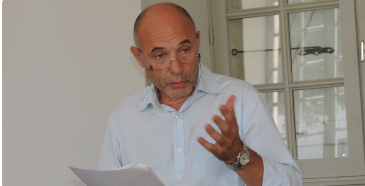
Promenades: Les condomois auront encore leur mot à dire

Les maquettes du programme d'aménagement dévoilées aux élus ce soir