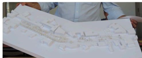
Les condomois pourront donner leur avis

Travaux fin de l'été 2017- 2018-2019. Pour un montant estimé entre 4 et 5 millions d'euros.