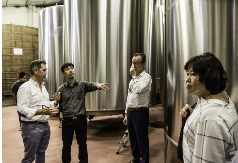
Poursuite des explications