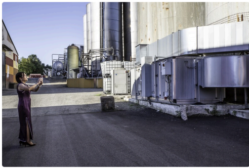
Une dame s'intéresse au système de refroidissement