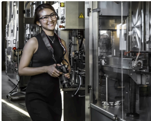
La photographe des visiteurs