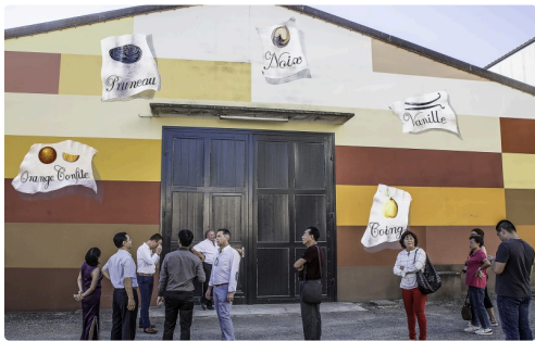
Les visiteurs apprécient la décoration du chai avant d'y entrer