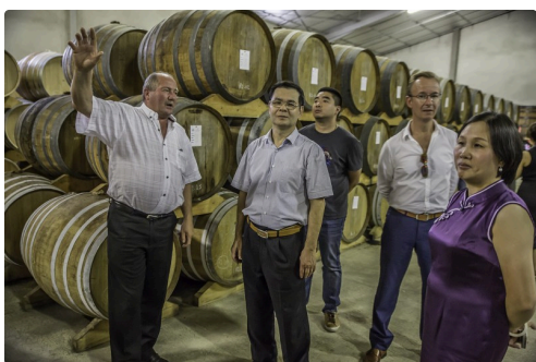
Explications relatives aux grands foudres