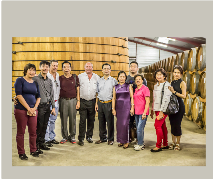
Nogaro – La Cave Les Hauts de Montrouge exporte en Chine

La « Guangzhou Shen Sui Yuan Trade Company » est venue en visite