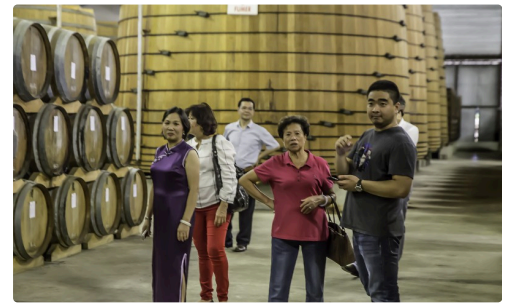
Dans le chai d'armagnac