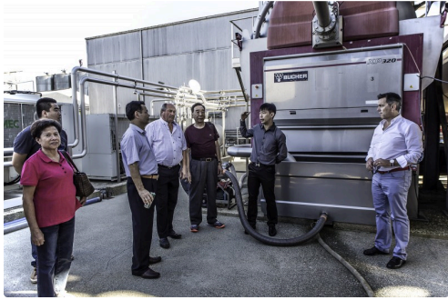
Explications n bas de la réception raisin