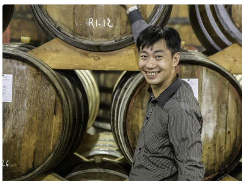
L'interprète préfère les fûts...