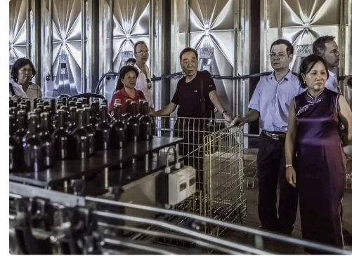
Visite de la chaîne d'embouteillage