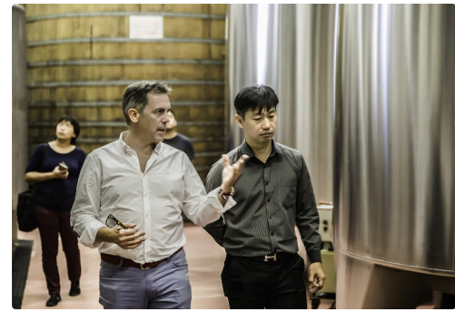
Explications dans ce chai