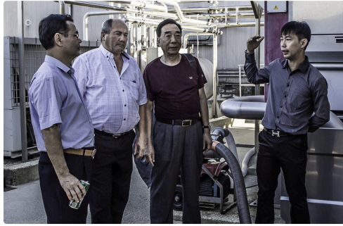
Les mêmes en gros plan