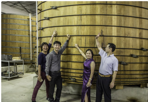
Les visiteurs posent devant un grand foudre d'armagnac