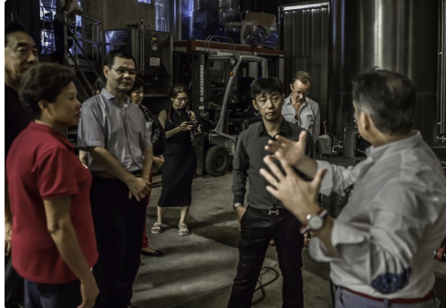
Poursuite des explications