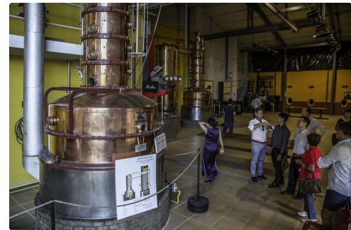
La visite se termine par la distillerie et ses alambics qui ont les noms des 3 Mousquetaires