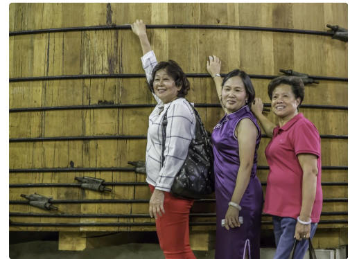
Les visiteurs posent devant un grand foudre d'armagnac