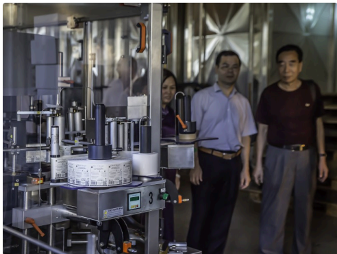
La chaîne d'embouteillage