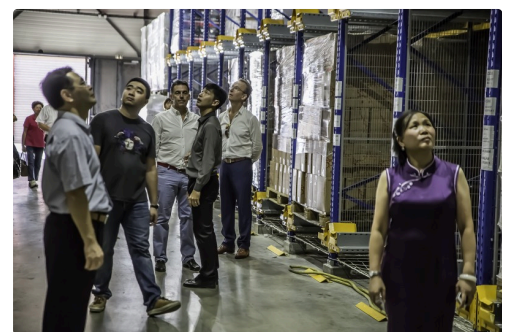
Dans le hangar de stockage automatisé du vin et du floc