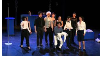
Humanisme en Fezensac