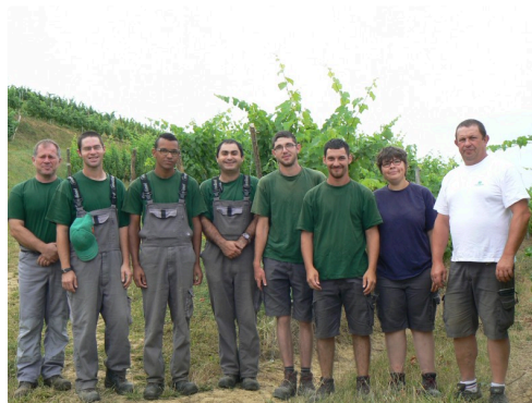
Le groupe affecté au travail dans la vigne