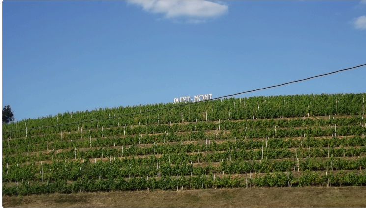
Le vignoble Rive-Haute de Plaimont

Depuis le printemps l'E S A T de Pagès le travaille en Bio