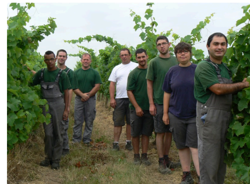
Dans un sillon