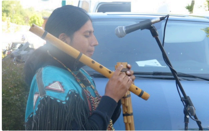
La flute de pan au marché

Mercredi le jour du marché hebdomadaire, les chalands étaient attirés par une image insolite. Une musicienne jouait de la flûte de pan. A la couleur de sa peau on pouvait deviner ses origines d'Amérique du Sud vraisemblablement proche de la Cordillère des Andes. La flûte de pan est un instrument de musique constitué de tuyaux de longueurs inégales et assemblés en radeau. En plus de donner un mini concert, cette sud-américaine proposait à la vente des produits artisanaux de son pays, des colifichets aux couleurs très vives.