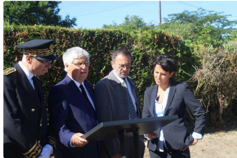
Les personnalités ont fait le parcours à pied jusqu'à la troisième plaque au carrefour de la Jalouse.