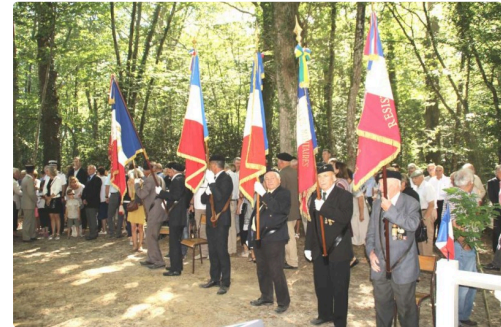
Au bois de Bascaules, les porte-drapeaux.