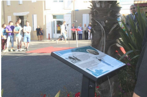
Le Pupitre explique le drame survenu en ce lieu.

Samedi matin, 6 août, à côté de la mairie, face à ce qu'était en 1944 l'Hôtel Lafontan, en présence des autorités civiles et militaires, d'anciens combattants et des habitants de la commune, madame la Ministre de l'Education Nationale, de l'Enseignement Supérieur et de la Recherche, Najat Vallaud-Belkacem a inauguré le Parcours de Mémoire du 6 août 1944. La cérémonie s'est prolongée à Toujouse, au bois de Bascaules, devant le monument des trois jeunes fusillés par les allemands.