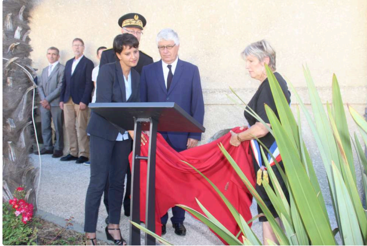
Le Houga : Najat Vallaud-Belkacem a inauguré le Parcours de Mémoire

Samedi matin, 6 août, à côté de la mairie, face à ce qu'était en 1944 l'Hôtel Lafontan, en présence des autorités civiles et militaires, d'anciens combattants et des habitants de la commune, madame la Ministre de l'Education Nationale, de l'Enseignement Supérieur et de la Recherche, Najat Vallaud-Belkacem a inauguré le Parcours de Mémoire du 6 août 1944. La cérémonie s'est prolongée à Toujouse, au bois de Bascaules, devant le monument des trois jeunes fusillés par les allemands.