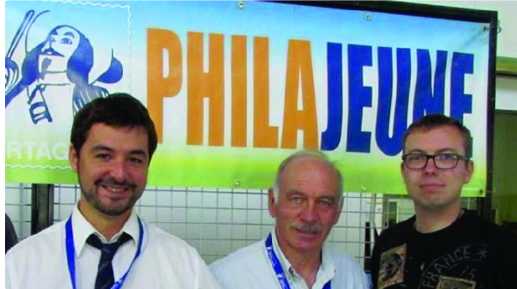
Avis aux philatélistes de tous ages

Philajeune, association philatélique créée voilà bientôt 30 ans, participe une nouvelle fois à l'animation du festival de BD à Eauze le 7 août prochain. Seize années de présence à Eauze, avec un souvenir philatélique nouveau chaque année.