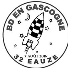
timbre BD eauze 2016.jpg