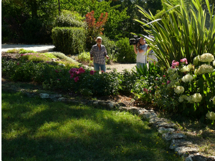
Castin : TF 1 a filmé le village aux deux fleurs

La chaîne de télévision TF 1 vient de rendre visite au village de Castin pour réaliser un reportage sur son fleurissement. Ce n'est pas tout à fait par hasard si la caméra y soit venue car depuis 2010 la commune est labellisée deux fleurs dans le cadre des villes et villages fleuris. Une constance qui est en passe de gravir l'échelon supérieur, les trois fleurs, tant les efforts d'embellissement sont de plus en plus notoires. Le maire Joël Mignano s'en défend : « Pour moi, avoue-t-il, l'objectif est de conforter la seconde fleur pour la commune. Pour la troisième fleur ce n'est pas à moi d'en parler ».