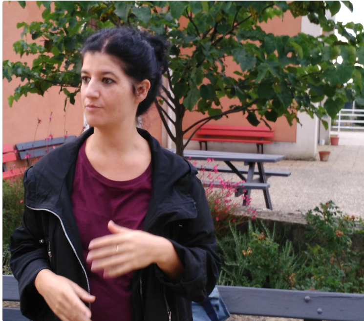
SAINT MARTIN Résidence d'artistes