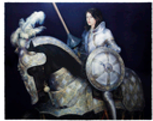
peinture équestre grand format 200cm sur 250cm léonor Solans