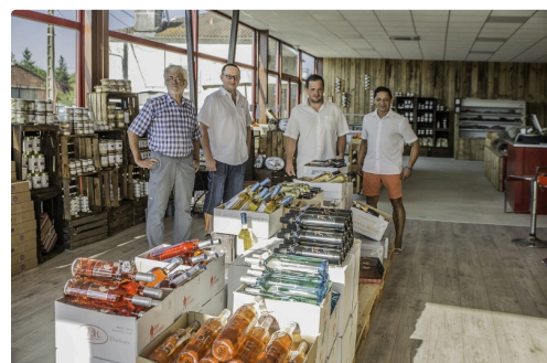
L'intérieur du magasin