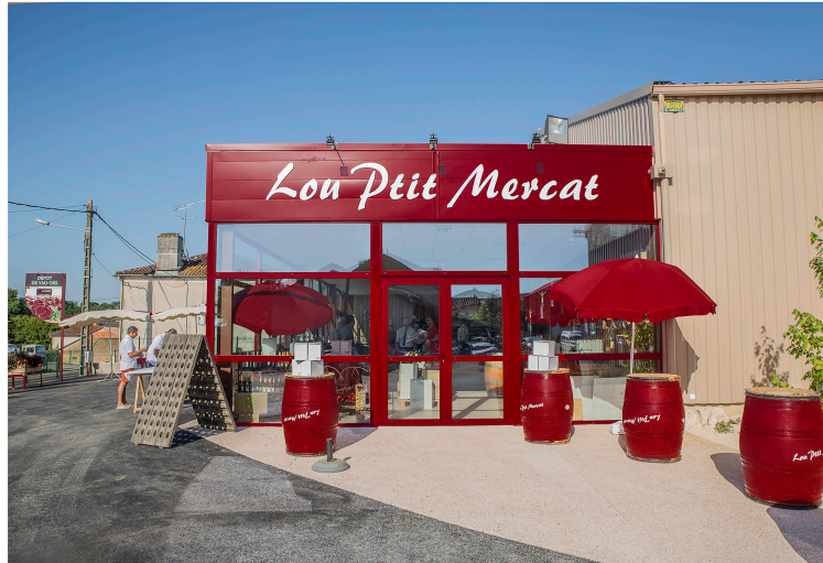
Manciet : Lou Ptit Mercat, une épicerie de copains a ouvert

On y trouve tout, du vin à la viande, des œufs aux fruits et légumes