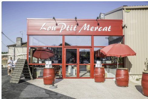
La façade de "Lou Ptit Mercat"