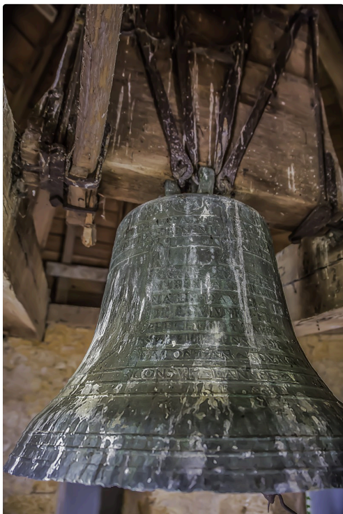
La fameuse cloche, œuvre d'un fondeur qui a fondu une cloche pour Notre-Dame-de-Paris