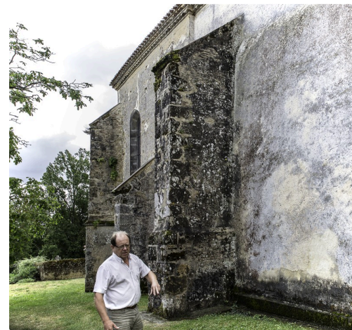
Le maire montre des travaux à faire