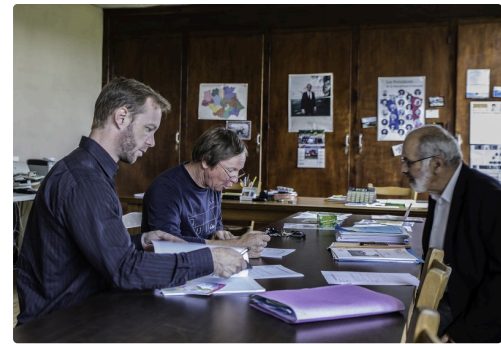
Séance de travail