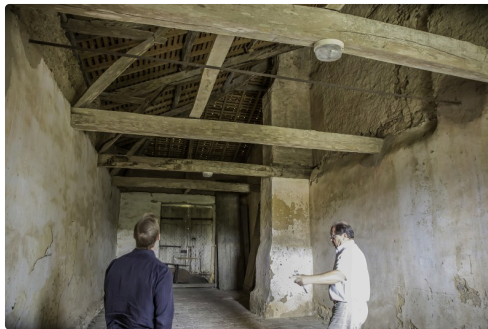
L'emban, que le maire voudrait mettre en valeur