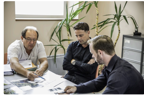
Séance de travail