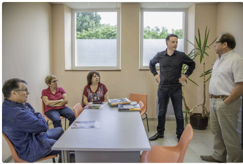
A Perchède le maire et des conseillers municipaux attendent le sous-préfet