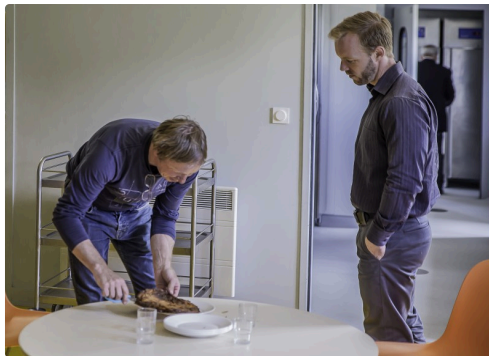
Le maire offre de la croustade dans la salle à manger des écoliers (attenante à la salle omnisports)