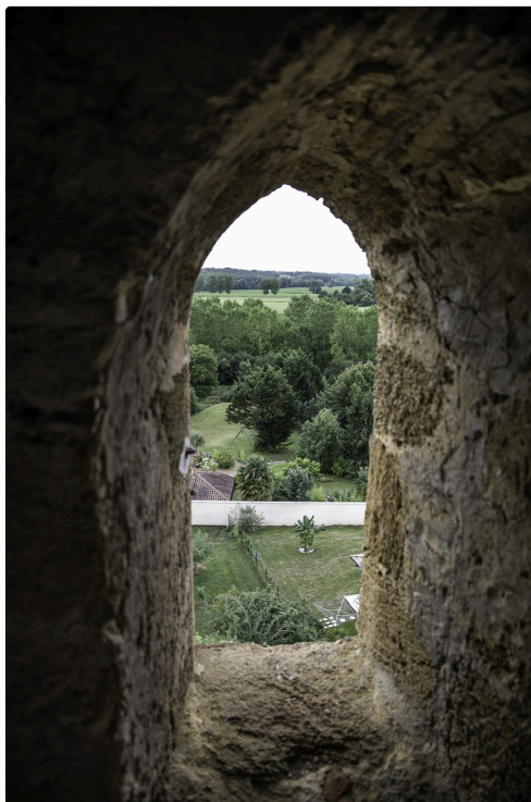
Vu depuis le clocher de l'église de Perchède