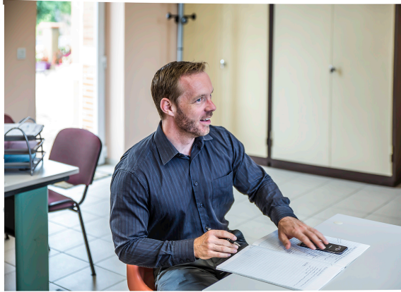
Perchède et Saint-Martin-d'Armagnac : le sous-préfet en visite

Se dit décidé à lever certains verrous administratifs