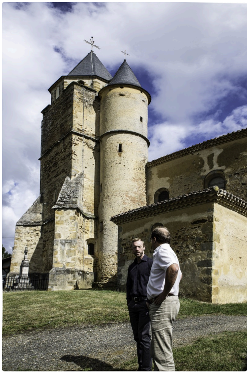
L'église avec sa tour pour l'escalier du clocher