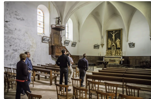
Visite de l'église