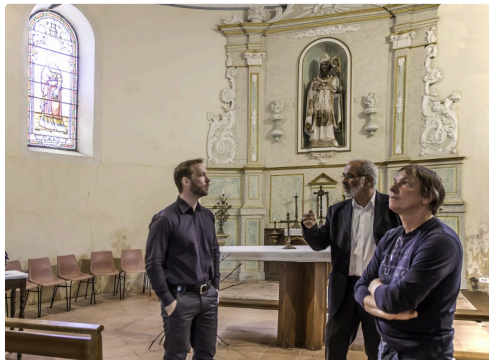
Visite de l'église