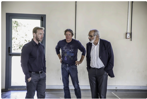
Visite de la belle salle omnisports accessible à tous les villages de la communauté de communes