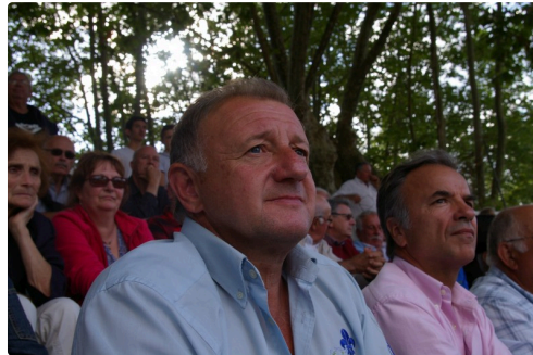
Dans les gradins son papa inquiet et ravi tout a la fois