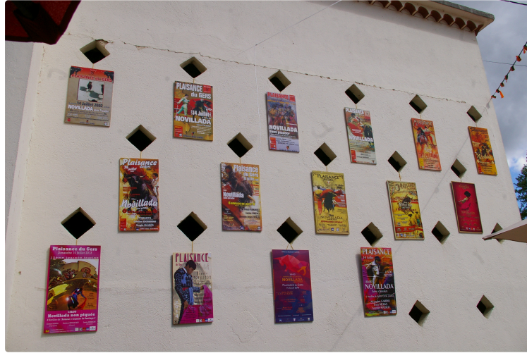
La journée taurine du 14 juillet

En quelques chiffres et en quelques images