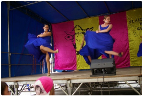
Media-Luna : de belles gambettes