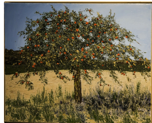
3 Tableau Francis Tuella 1bis 070716.jpg