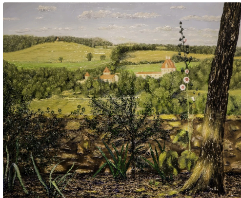
4 Tableau Francis Tuella 1bis 070716.jpg