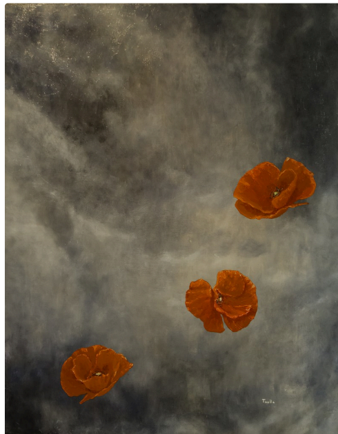
2 Tableau Francis Tuella 1bis 070716.jpg