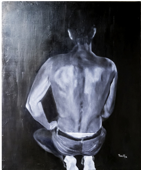
7 Tableau Francis Tuella 1bis 070716.jpg