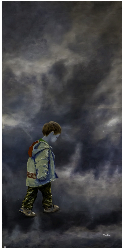
1 Tableau Francis Tuella 1bis 070716.jpg