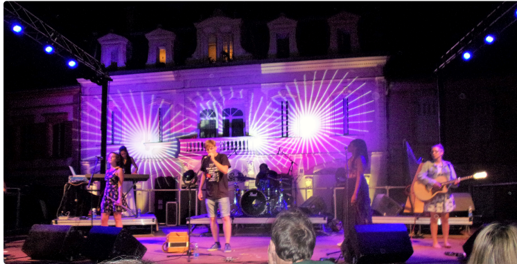
Succès pour "Escota é Minja"