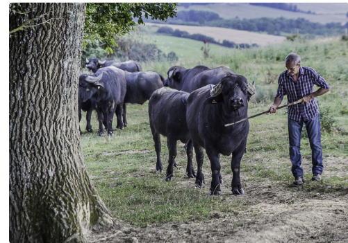
Martial grattouille un buffle qui en redemande !