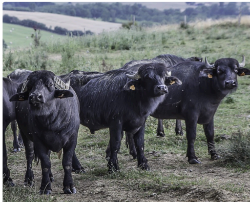
Ils regardent les visiteurs