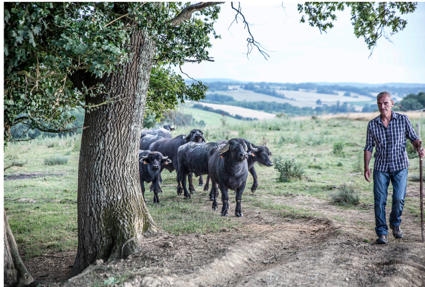
Aignan – La ferme-auberge aux buffles est ouverte

Un joli restaurant, des buffles et des kangourous en liberté