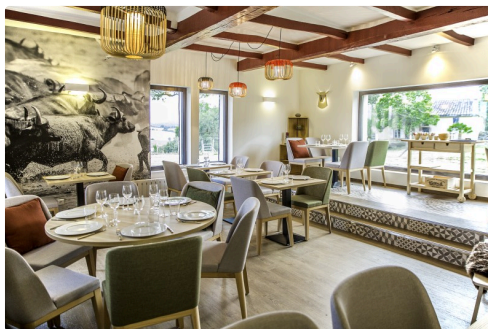
La salle d'un bout...