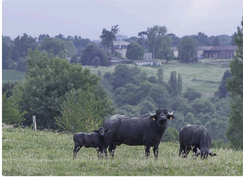
Une femelle buffle et son veau nouveau-né