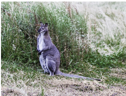
Le kangourou curieux