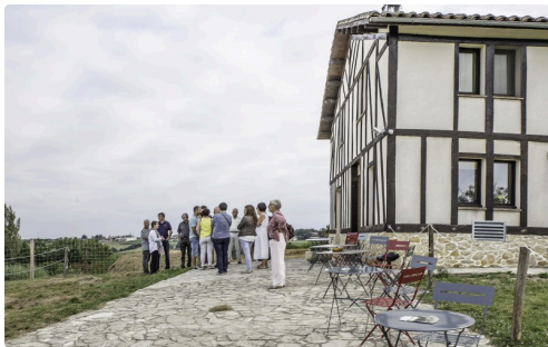
Les invités commencent tout juste à arriver...