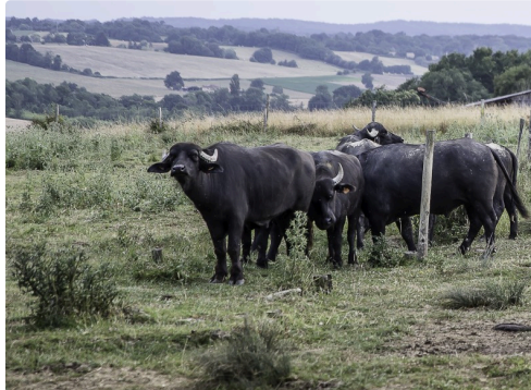
Les animaux s'approchent encouragés par Martial