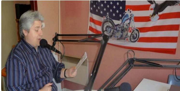
Fréquence country, la Radio au coeur du festival

92.3 la bonne fréquence pour être dans le ton