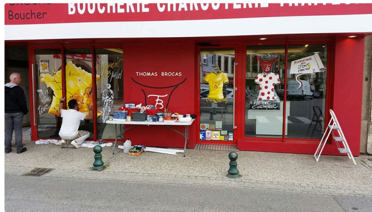
Tour de France 2016