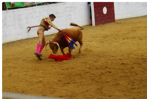
Son estocade au Casanueva