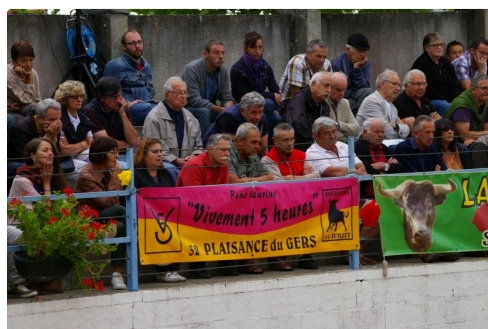
Les Plaisantins nombreux en tribunes sont sercins pour le 14