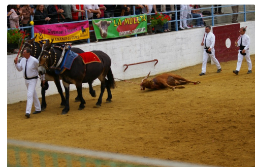
La vuelta du Casanueva des frères Bats