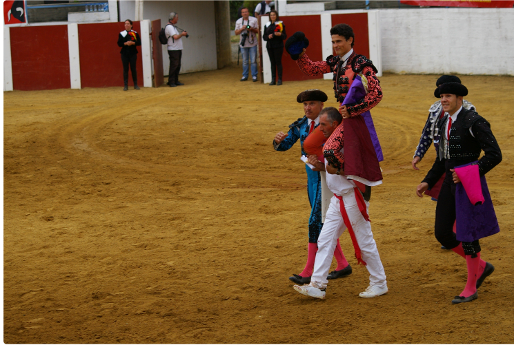
Novillada Concours de Castelnau : Gers trois Landes deux

C'était une des plus belles depuis la création