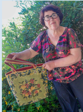
Caupenne-d'Armagnac : des cabas avec de la récup

Les Papillons jaunes les créent et les décorent