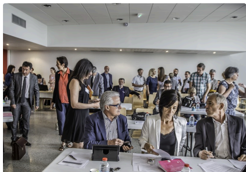
Le Conseil départemental s'installe