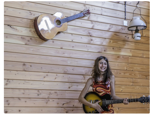
Le coin des musiciens dans le salon