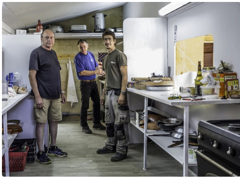
Et voici la cuisine et les cuisiniers