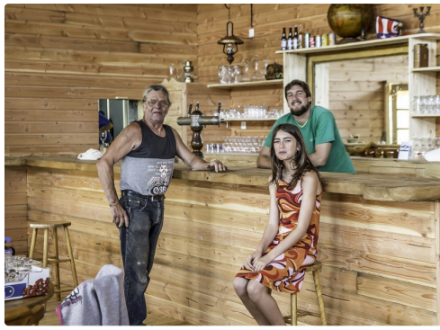
Le bar est opérationnel lui aussi