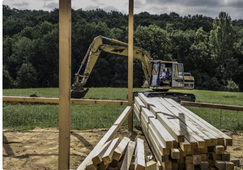
On creuse un fossé pour l'écoulement des eaux