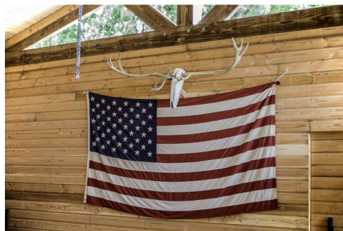
Mais il y a aussi le drapeau des Yankees