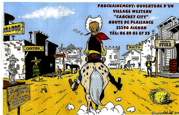
Aignan : Carchet City ouvre dimanche 3 juillet