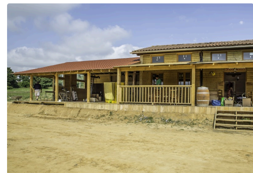
A gauche du saloon, c'est la cantina mexicaine