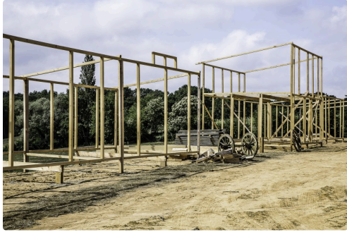
Les squelettes des façades des bâtiments en construction