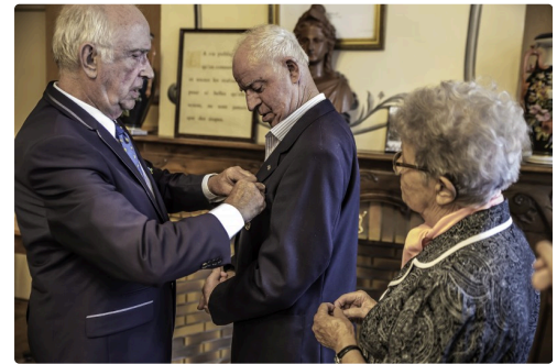
Remise de la médaille d'or