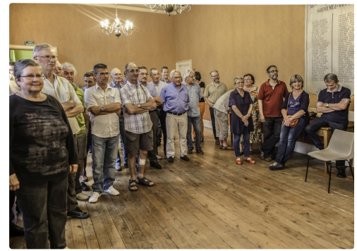
Vue de l'assistance