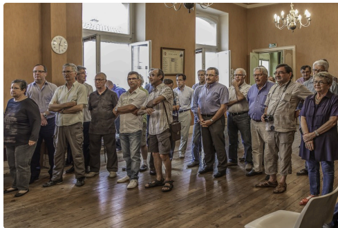
Vue de l'assistance