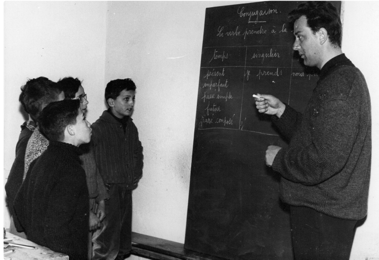
Avis de recherche sur le passé