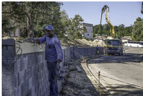
En venant de la rue d'Estalens le 22 juin

Les travaux avancent vite...Une fois finis, ils seront présentés à nos lecteurs.