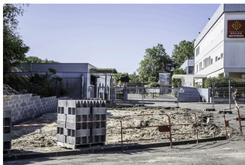
Devant l'entrée de la cité scolaire