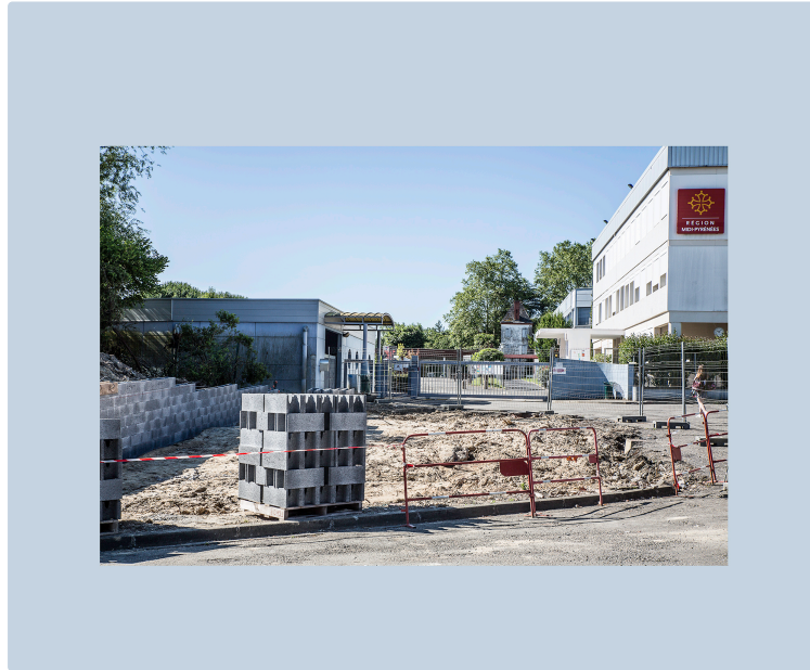
Nogaro : la place devant la cité scolaire est agrandie et rénovée

Les allées et venues et les flâneries des élèves seront sécurisées