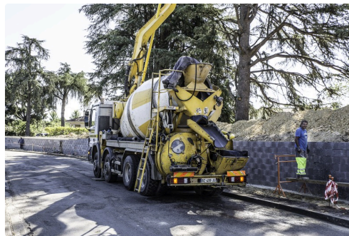
Vue dans l'autre sens