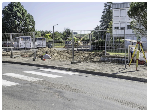
L'avenue des Pyrénées est également touchée par les travaux