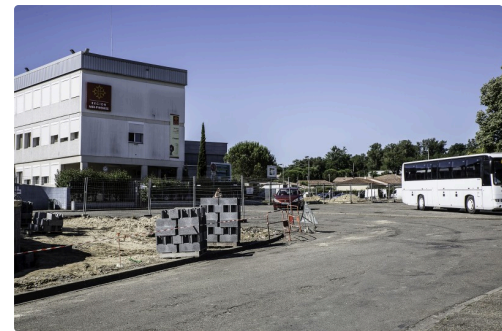
Devant l'entrée de la cité scolaire