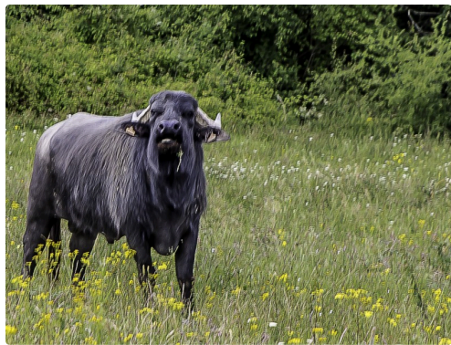
Un autre buffle curieux