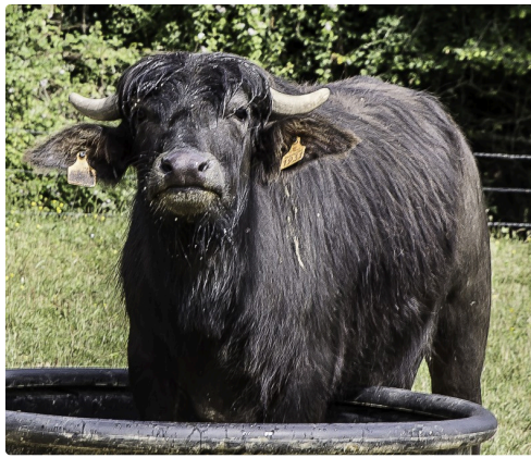
Jeune buffle en train de boire