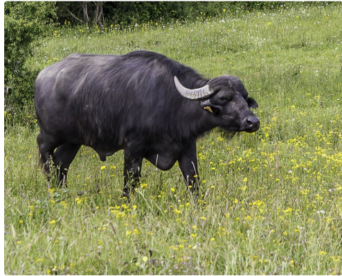
Le même en ros plan