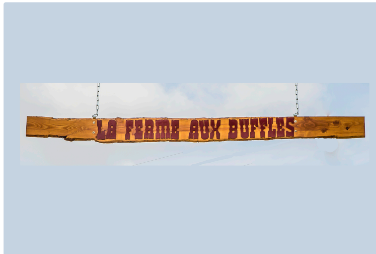
Aignan : la Ferme aux buffles va ouvrir une auberge dans un site superbe

Avec buffles, âne, cochon et chèvres naines, oies et lapins