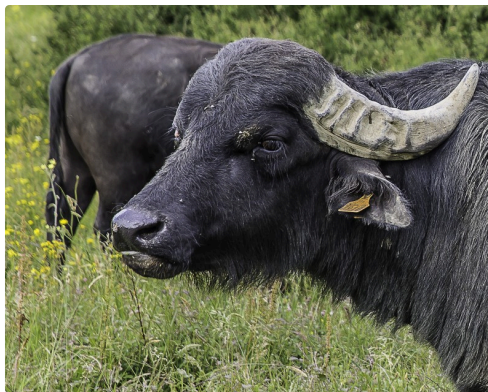
Autre gros plan