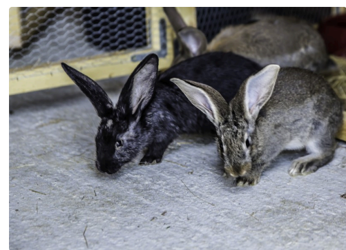
Les lapereaux de la race géants des Flandres