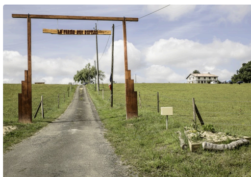
L'entrée ; en haut à droite, la ferme auberge

(1) D'après le site : ( http://www.bioactualites.ch/fr/production-animale/bovins/vaches-laitieres/wasserbueffel.html ). (2) Lieu-dit Lectoure 32290 Aignan (voir l'itinéraire ci-dessous) Tél. : 06 29 28 31 53 ; courriel : lafermeauxbuffles@orange.fr