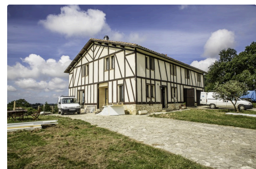
La ferme auberge