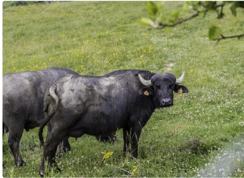
Un autre animal