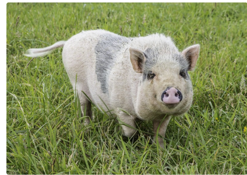
La truie naine est très sociable