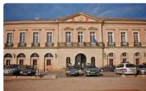
Conseil Municipal de L'Isle-Jourdain