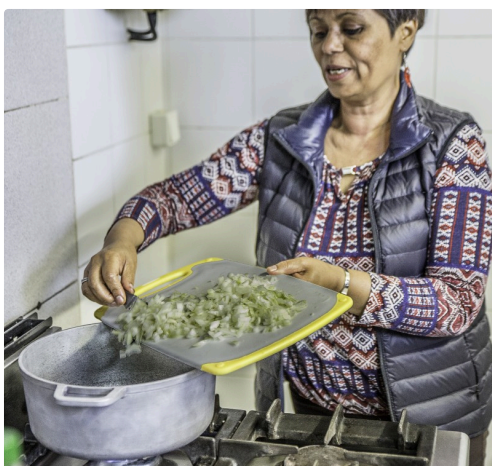
Cuisson de la sauce