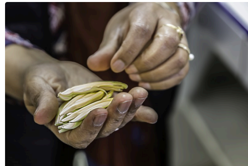
Les bébés bananes dans les mains de Nadia