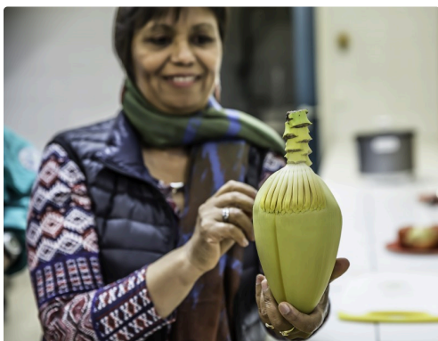
On arrive au moment où la fleur devient tendre