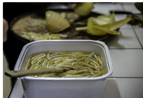
La bassine réceptacle