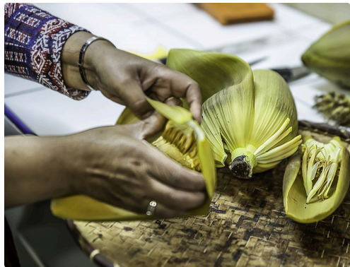
Début de l'épluchage