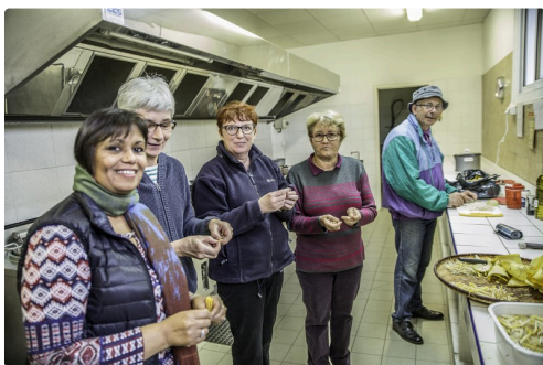
Toute l'équipe suit les opérations