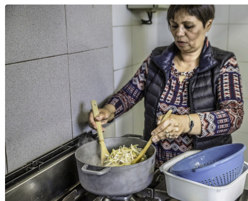
Mise en cocotte de la fleur de bananier