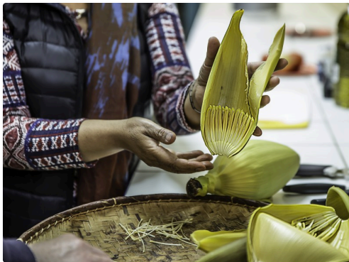
Récupération des bébés bananes