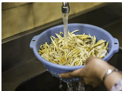
Rinçage avant cuisson