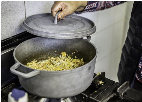
16 Nadia Boyer 1bis principale 020616.jpg