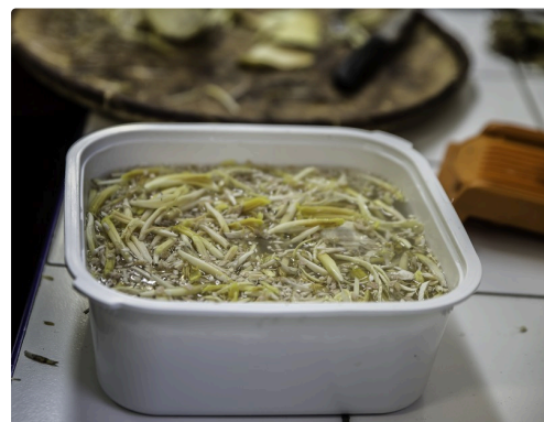
La récupération des parties comestibles est terminée