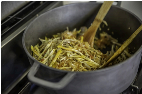
C'est à point !