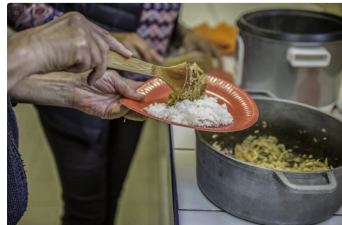
Il n'y a plus qu'à servir avec la sauce t le riz