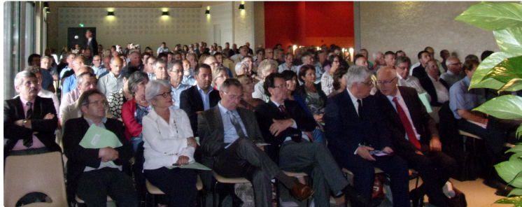
Touget accueille la réunion des élus