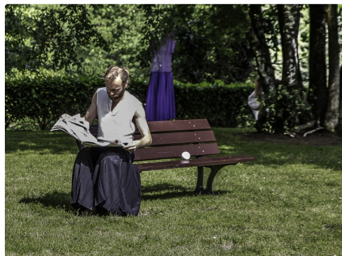
Le spectacle commence, l'artiste est cachée derrière un arbre