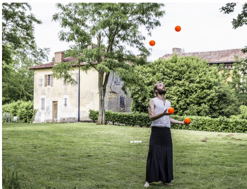
Séquence de jonglage