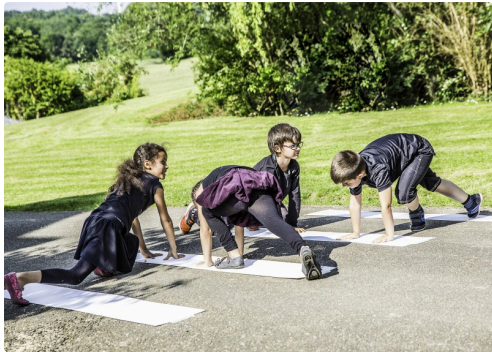
Evolutions des élèves de l'école de Manciet