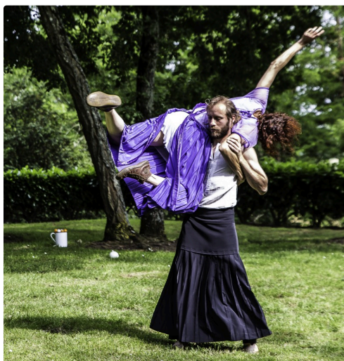
Les danseurs se disputent le journal