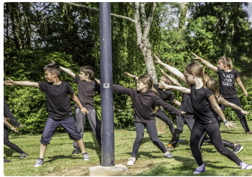
Evolutions des élèves de l'école de Manciet