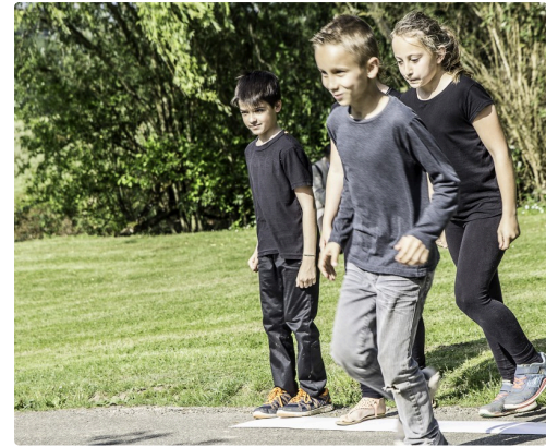
Evolutions des élèves de l'école de Manciet