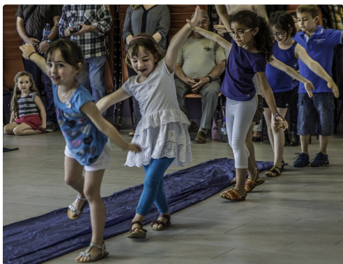
Evolutions des enfants de l'école de sainte-Christie-en Armagnac