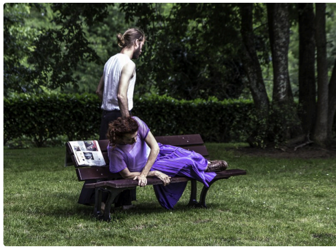
Elle le dérange dans sa lecture