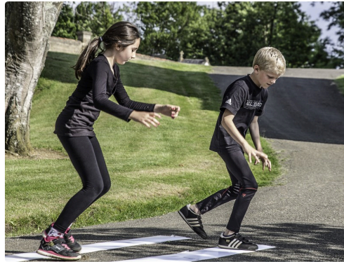
Evolutions des élèves de l'école de Manciet