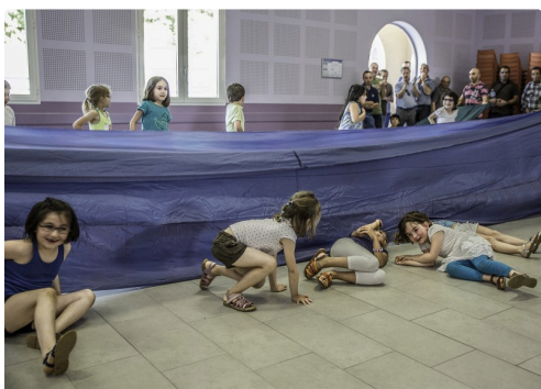
Evolutions des enfants de l'école de Sainte-Christie-en Armagnac