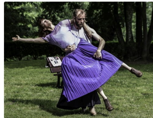
Le couple danse