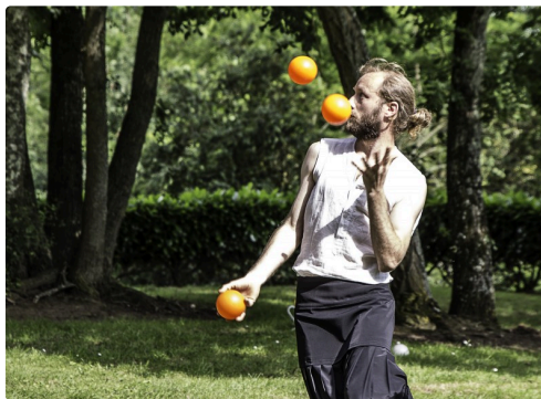
Séquence de jonglage