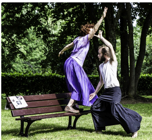
Les danseurs se disputent le journal