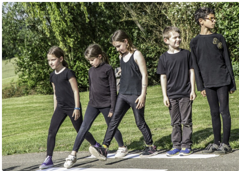
Evolutions des élèves de l'école de Manciet