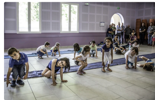
Evolutions des enfants de l'école de Sainte-Christie-en Armagnac