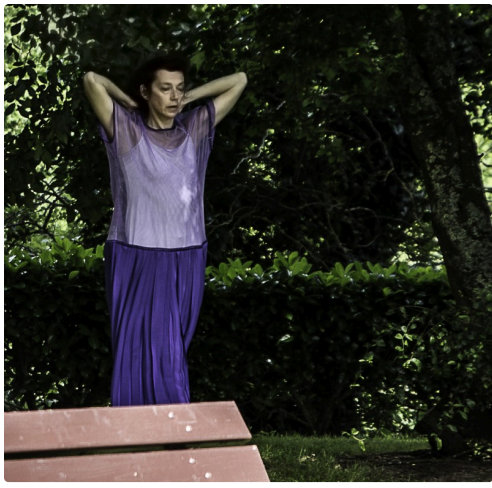
Elle se rapproche de son partenaire