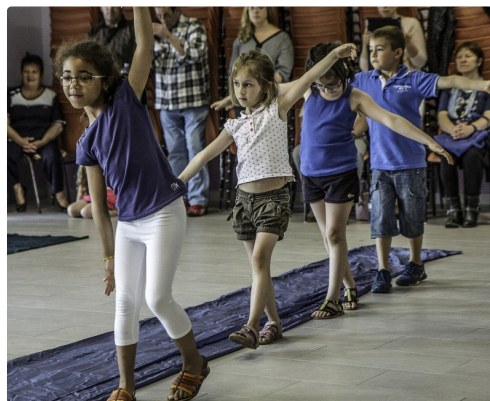
Evolutions des enfants de l'école de sainte-Christie-en Armagnac