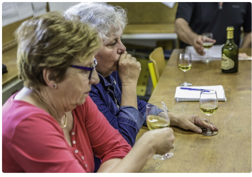
Les dames sont studieuses