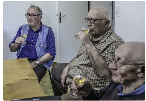
Les messieurs ne le sont pas moins