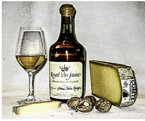
Le clavelin