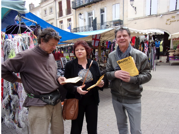
"BASTIR Gascogne Toulousaine " était à Fleurance ce mardi.

Pour que le nom de notre nouvelle région soit : "Occitanie"