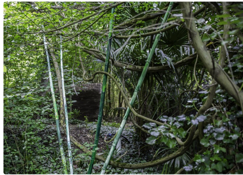
11 Bambous verts 1bis 270516.jpg