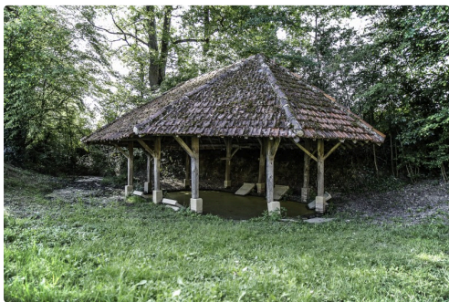
Le lavoir sous un autre angle

Le spectacle dure 55 mn. Il est conseillé à partir de 8 ans. Et après le spectacle, il y a un apéro offert.