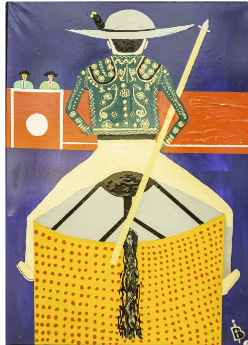
10 Expo Bruno Imart au Solenca 1bis 140516.jpg