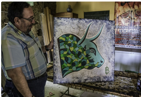
h Dans l'atelier 1bis 170516.jpg