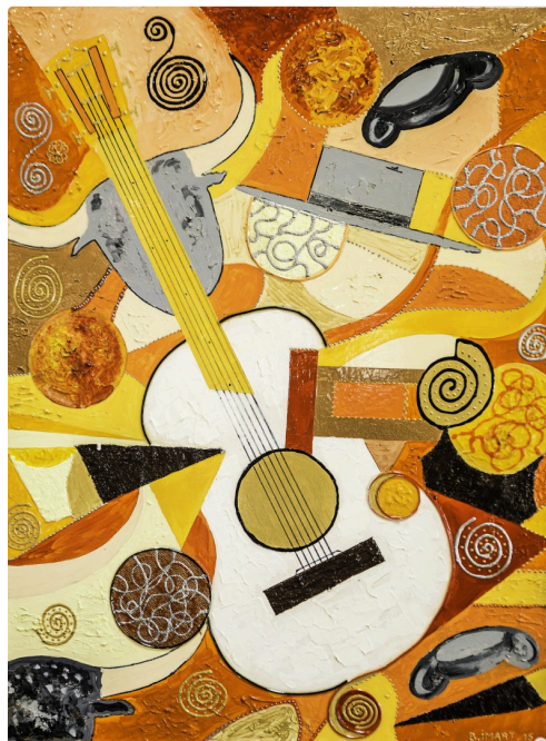
18 Expo Bruno Imart au Solenca 1bis 140516.jpg