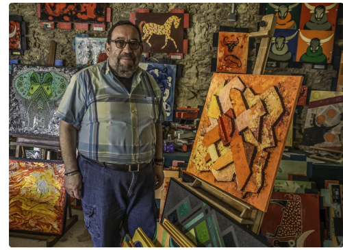
d Dans l'atelier 1bis 170516.jpg