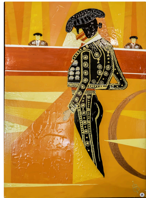
16 Expo Bruno Imart au Solenca 1bis 140516.jpg