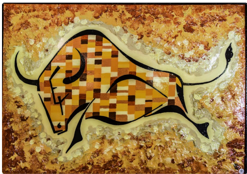
14 Expo Bruno Imart au Solenca 1bis 140516.jpg