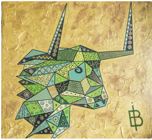
1 Expo Bruno Imart au Solenca 1bis 140516.jpg