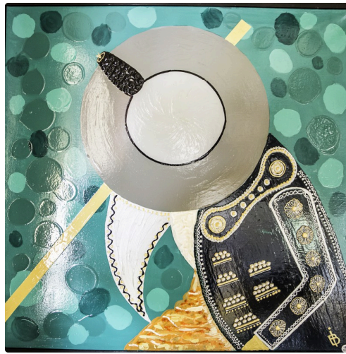
12 Expo Bruno Imart au Solenca 1bis 140516.jpg