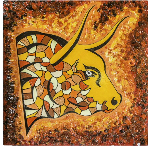
7 Expo Bruno Imart au Solenca 1bis 140516.jpg