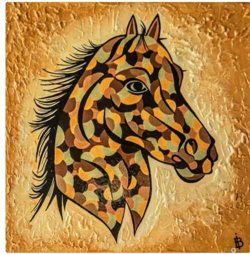
4 Expo Bruno Imart au Solenca 1bis 140516.jpg