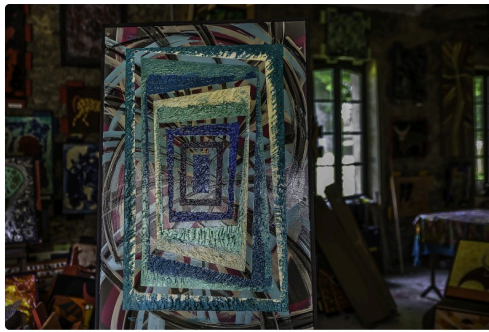
Dans le style Vasarely