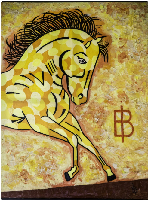
11 Expo Bruno Imart au Solenca 1bis 140516.jpg