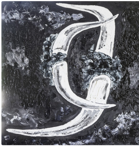
2 Expo Bruno Imart au Solenca 1bis 140516.jpg