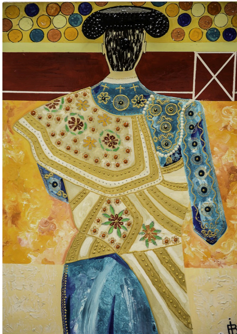
9 Expo Bruno Imart au Solenca 1bis 140516.jpg