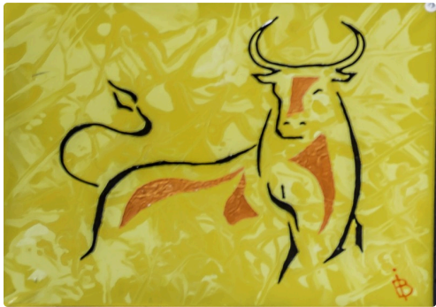
8 Expo Bruno Imart au Solenca 1bis 140516.jpg