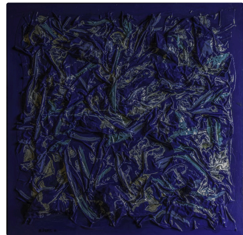
"Hommage à Majorelle