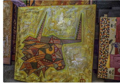
g Dans l'atelier 1bis 170516.jpg