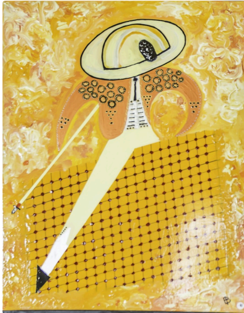
6 Expo Bruno Imart au Solenca 1bis 140516.jpg