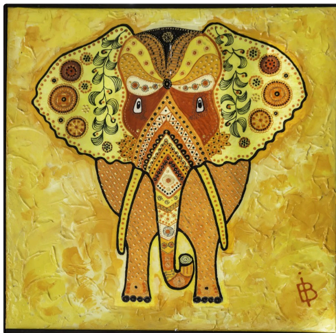
i Dans l'atelier 1bis 170516.jpg