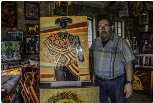
k Dans l'atelier 1bis 170516.jpg