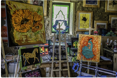
e Dans l'atelier 1bis 170516.jpg