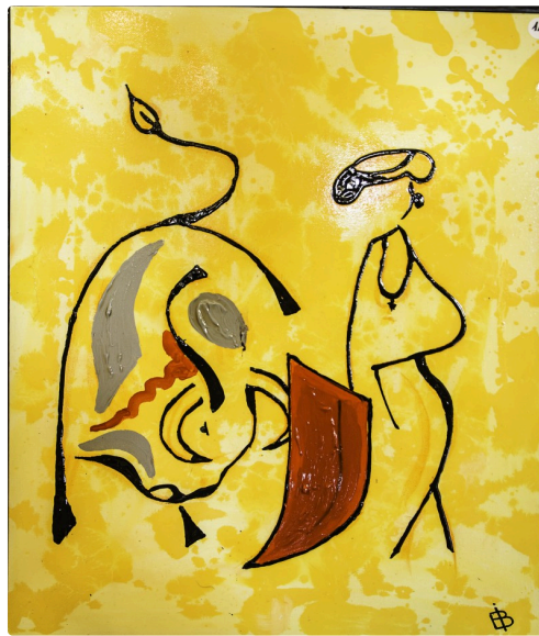
15 Expo Bruno Imart au Solenca 1bis 140516.jpg