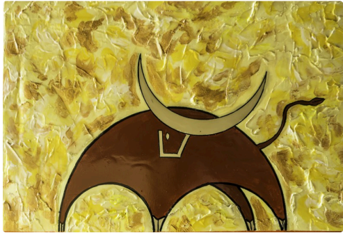
5 Expo Bruno Imart au Solenca 1bis 140516.jpg