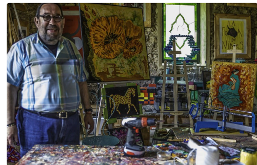
b Dans l'atelier 1bis 170516.jpg