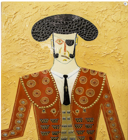
17 Expo Bruno Imart au Solenca 1bis 140516.jpg