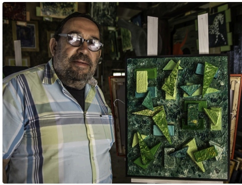
c Dans l'atelier 1bis 170516.jpg