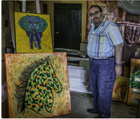
f Dans l'atelier 1bis 170516.jpg