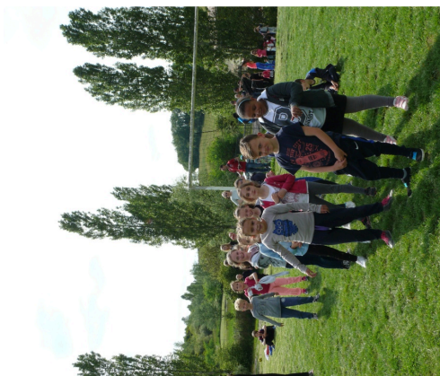
A chacun tour, pas plus de trois à la fois.