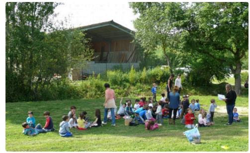
Un peu d'ombre avant de s'envoler.