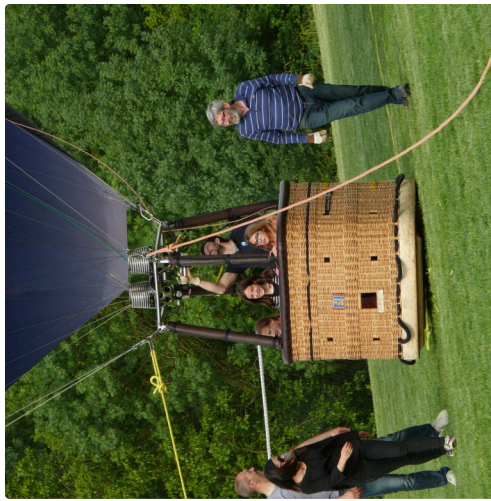
Prêts pour le départ.