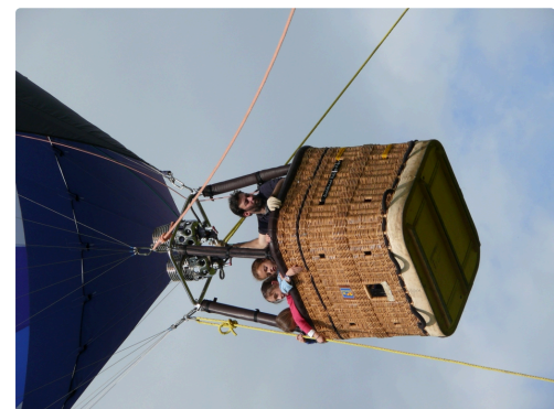
Que c'est beau depuis la-haut.