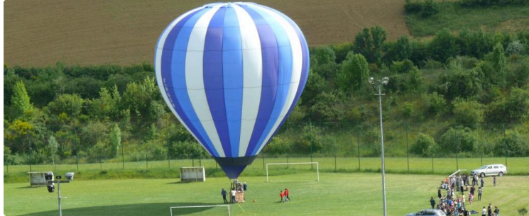
Balonis, une drôle d'histoire de montgolfière

Balonis, il était bien là sur le terrain de football avant de repartir avec sa nacelle et son gros ballon, de quoi ébahir la soixantaine d'enfants, (CE1 à CM2), lorsqu'ils découvrirent son récit. Car Balonis en septembre dernier avait échoué sur le toit de l'école et la curiosité des écoliers faisant le reste, il fut bien obligé de raconter son histoire. C'est vrai qu'il parlait et donc il pouvait raconter ses aventures vécues en faisant le tour du Monde. Et il ne s'en est pas privé car dans sa nacelle il y avait pas mal de surprises comme par exemple des animaux, éléphants, kangourou, panda, tortue ... mais aussi des friandises parce qu'il avait traversé le pays des friandises !