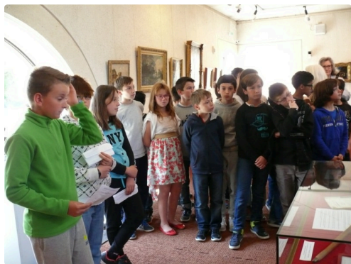
Une partie des élèves qui ont assisté à la cérémonie commémorative de l'abolition de l'esclavage.

Les élèves concluent la cérémonie par la lecture de textes se rapportant sur l'abolition de l'esclavage.