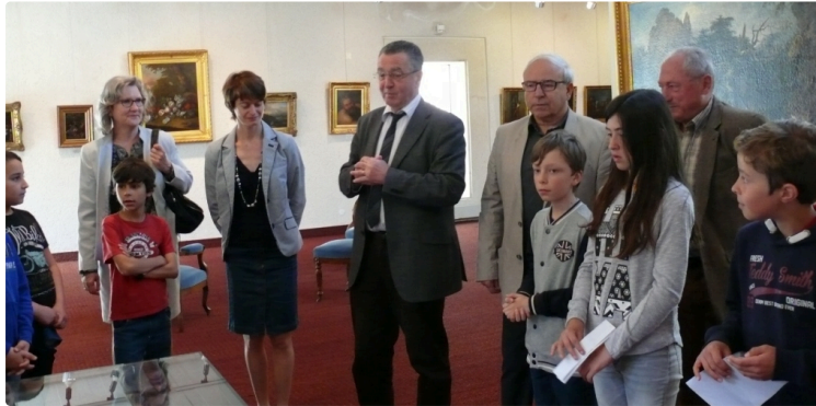
L'abolition de l'esclavage a été commémoré le 10 mai au musée des Beaux Arts

Les élèves de CM 2 étaient présents à la cérémonie