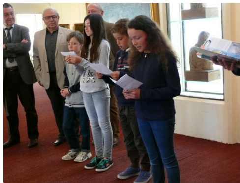
Les élèves ont lu des textes se rapportant sur l'abolition de l'esclavage.