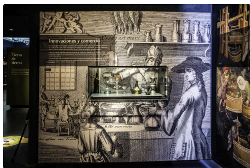
29 Panneau 1bis 070516.jpg