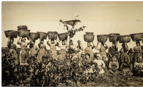
35 Panneau de vendangeuses 1bis 070516.jpg