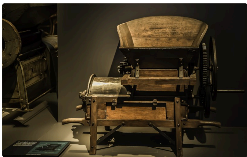
12 Machine à fouler 1bis 070516.jpg