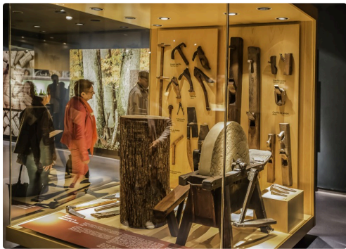
37 2e salle Outils de tonnellerie 1bis 070516.jpg