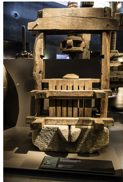
14 Pressoir catalan 1bis 070516.jpg