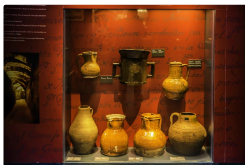
32 Récipients de table 1bis 070516.jpg