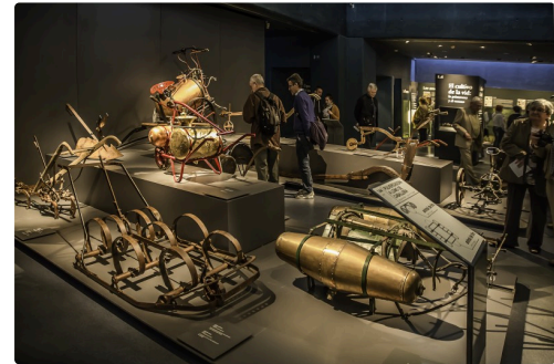
19 Outils groupés 1bis 070516.jpg