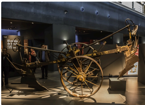
20 Charrue 1bis 070516.jpg