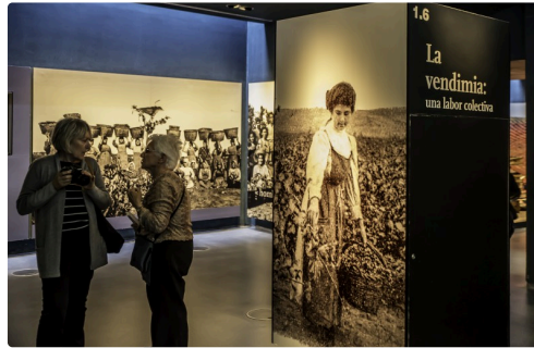
18 Les murs 1bis 070516.jpg