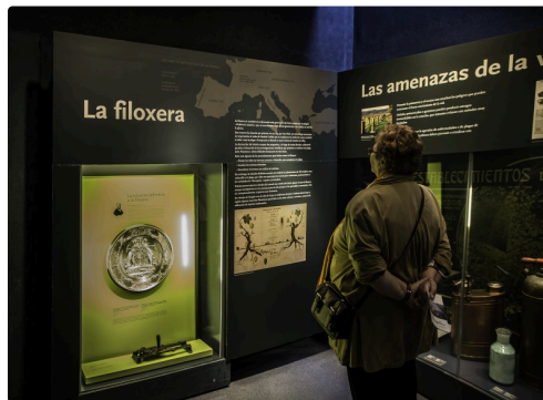
21 Le Phylloxéra 1bis 070516.jpg