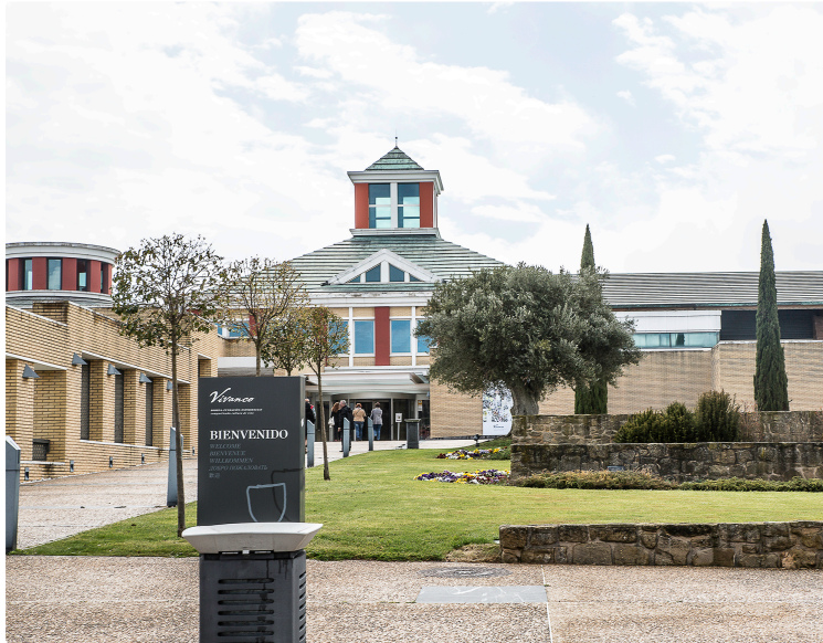
Toujouse pourra s'inspirer du Musée de Briones (Espagne – Rioja) (1e partie)

Le Musée du paysan gascon a visité ce Musée de la culture du vin