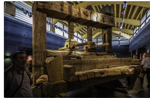
8 Mème pressoir 1bis 070516.jpg