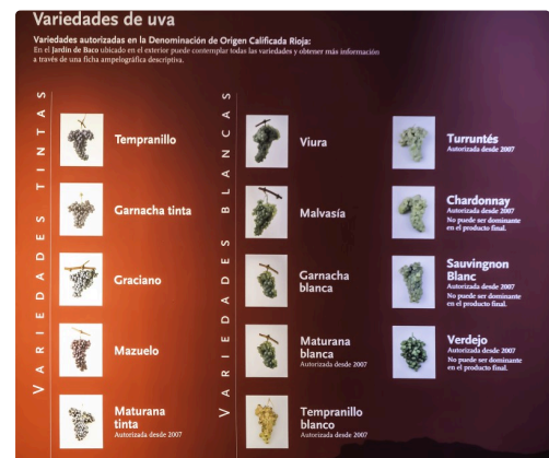
33 Cépages du Rioja 1bis 070516.jpg