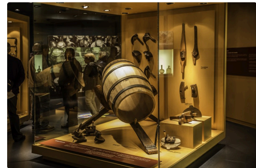
39 Fabrication d'un tonneau 1bis 070516.jpg