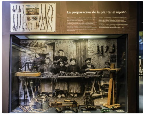
23 La greffe 1bis 070516.jpg