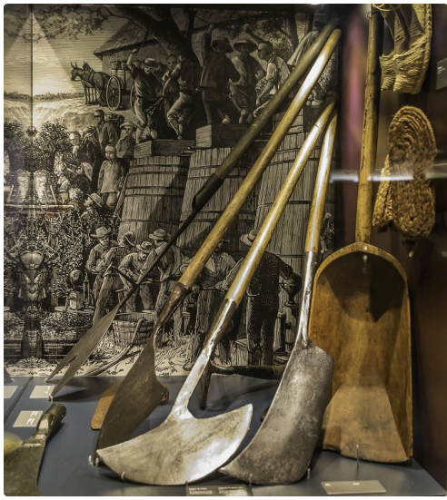
15 Vitrine d'outils à main 1bis 070516.jpg