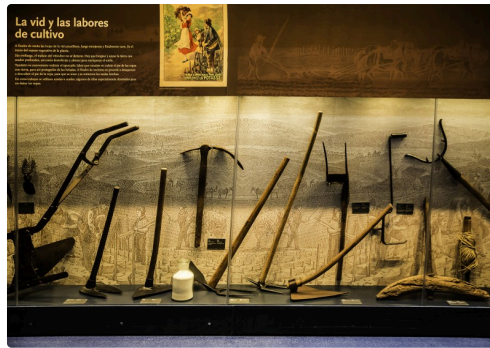
15bis Vitrine d'outils à main 1bis 070516.jpg