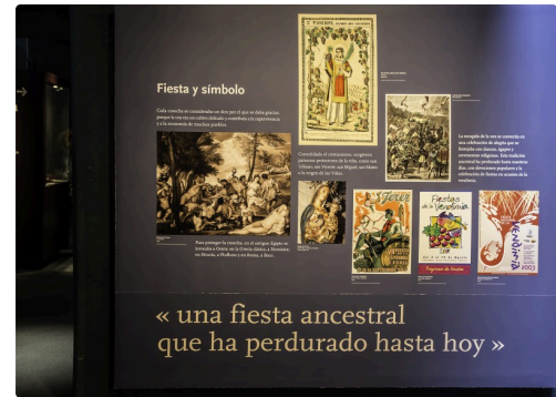
36 Panneau avec fêtes païennes et saints patrons 1bis 070516.jpg