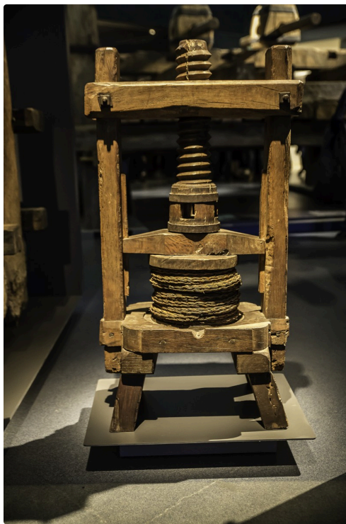
13 Machine 1bis 070516.jpg