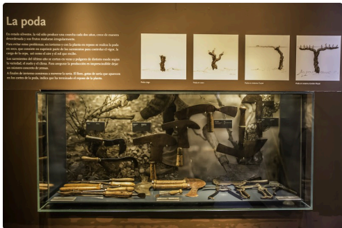
34 La taille 1bis 070516.jpg