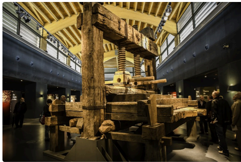
7 Pressoir 1bis 070516.jpg