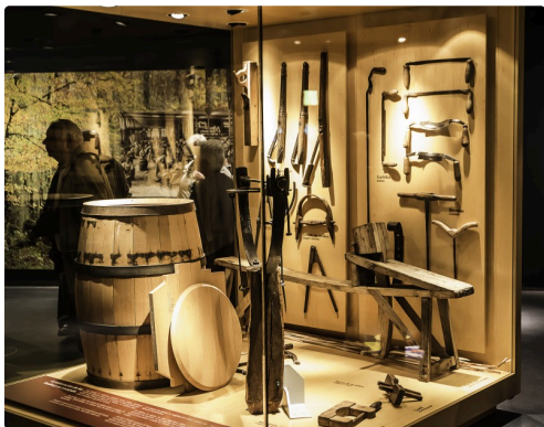
39bis Fabrication d'un tonneau 1bis 070516.jpg