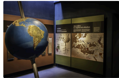
25 Histoire de la viticulture 1bis 070516.jpg