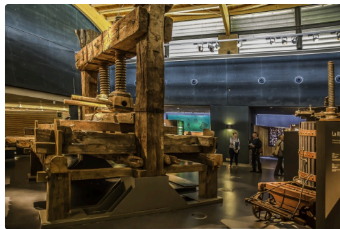
27 2e salle Pressoirs 1bis 070516.jpg