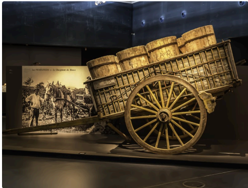
17 Tombereau aux vendanges 1bis 070516.jpg