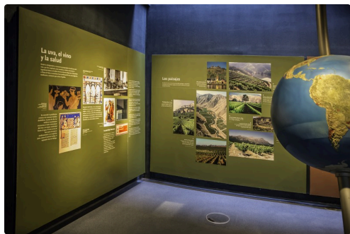
26 Histoire de la viticulture 1bis 070516.jpg