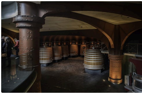
2 La cave 1bis 070516.jpg