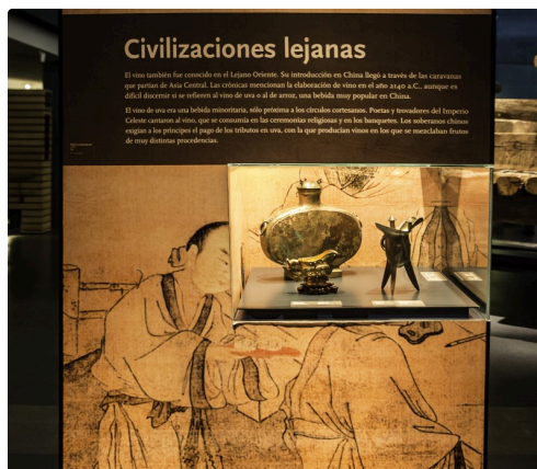
29 Panneau et vitrine civilisations éloignées 1bis 070516.jpg