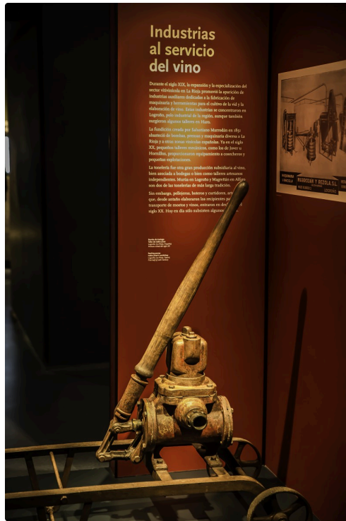
24 Instrument de tonnellerie 1bis 070516.jpg