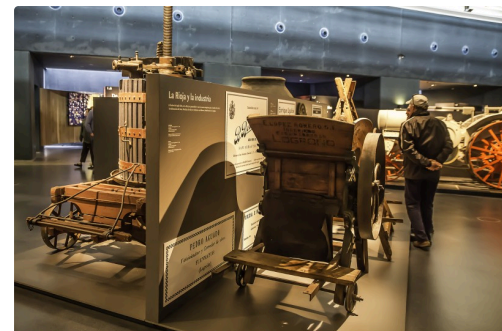
28 2e salle autres machines 1bis 070516.jpg