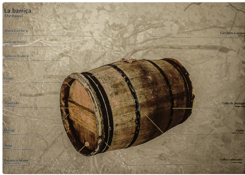
37bis description d'un tonneau 1bis 070516.jpg