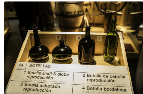
41 Bouteilles 1bis 070516.jpg