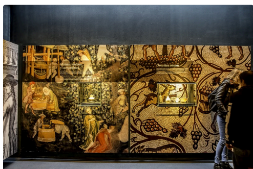
31 Viticulture dans la Rome antique 1bis 070516.jpg