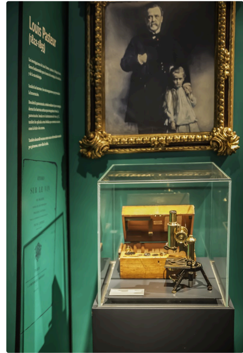
11 Pasteur 1bis 070516.jpg