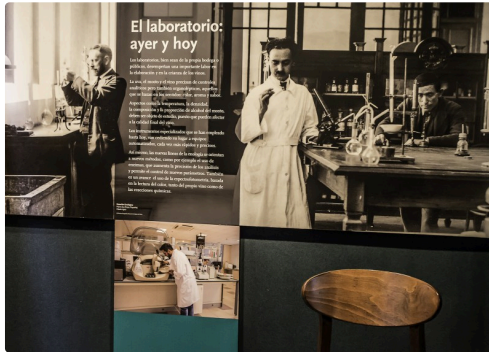
10 Mur labo 1bis 070516.jpg