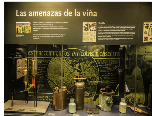
21 bis Le traitement 1bis 070516.jpg