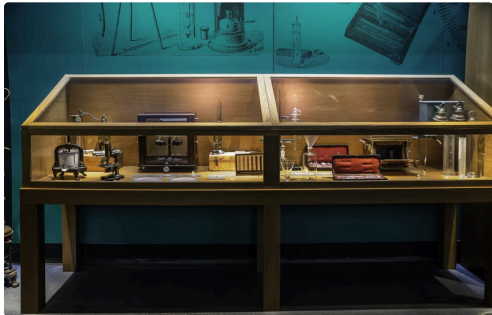
9 Vitrine 1bis 070516.jpg