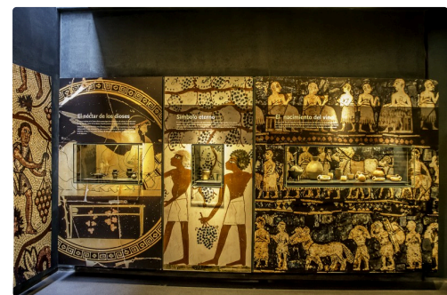
30 Le vin dans l'Egypte ancienne 1bis 090516.jpg