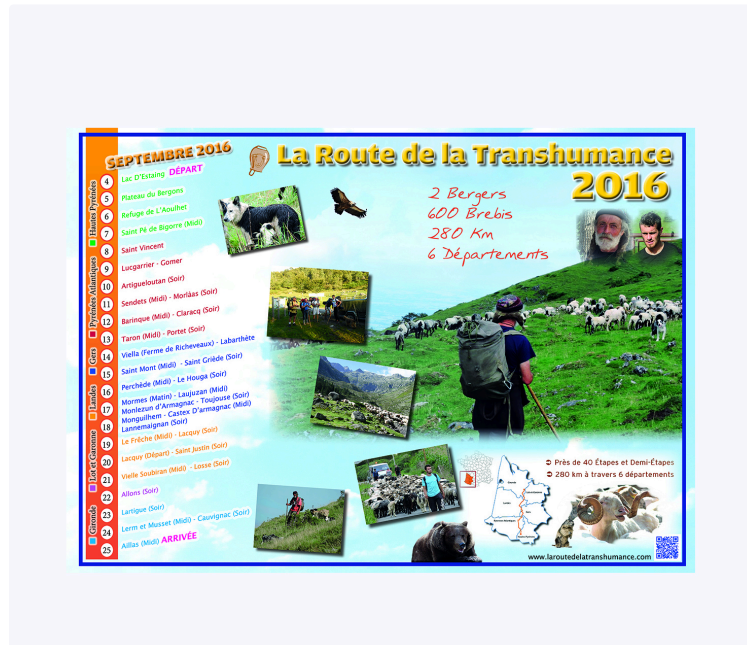
À Toujouse on prépare le parcours de la transhumance

En septembre les 600 brebis quitteront leur estive des Pyrénées