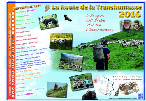
L'affiche du parcours de septembre 2016