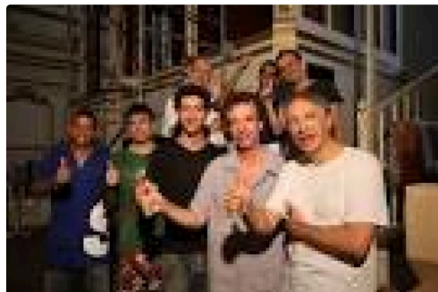
2 Avec les "Facteurs " à Rio