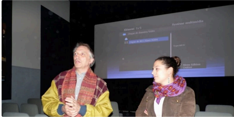
La construction de l'Orgue de Rio

La chaîne K T O rediffuse le film de Marika Julien