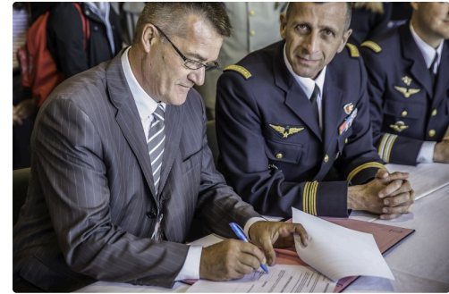
Gros plan sur les signataires et...