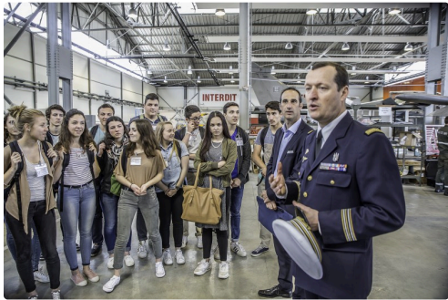
Le lieutenant-colonel commandant l'Esta donne des explications