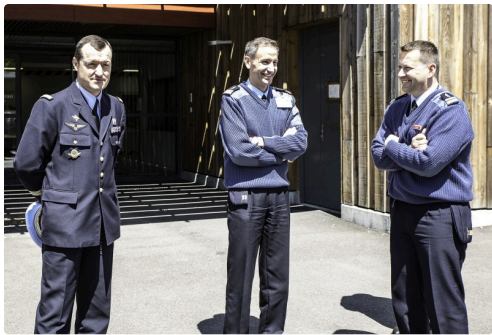
Accueil des Nogaroliens par les officiers