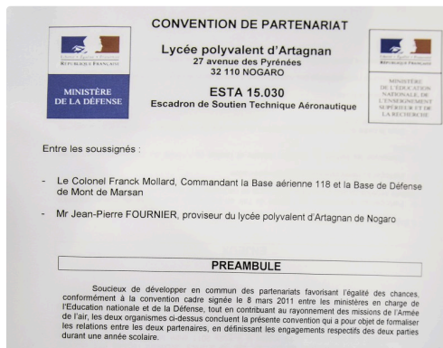
En-tête de la convention