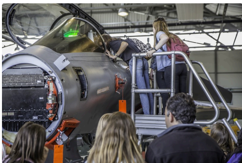
Un intérêt marqué