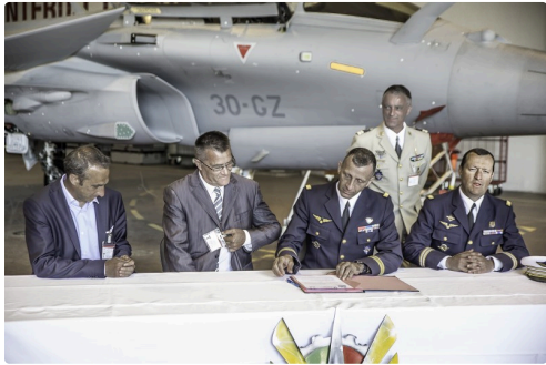
La signature de la convention se prépare