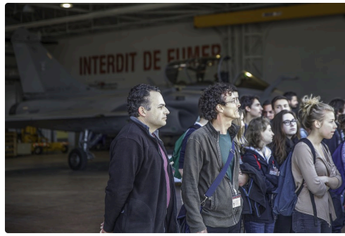
Les têtes se tournent : un Rafale décolle...