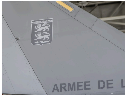
Le Rafale fait partie de l'escadron qui porte les traditions du Régiment Normandie-Niemen