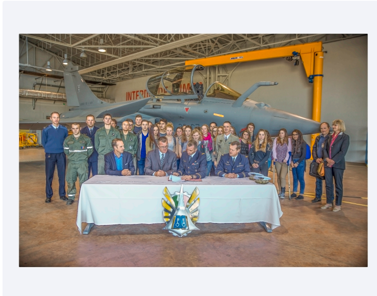
Convention entre cité scolaire de Nogaro et base aérienne de Mont-de-Marsan

Des classes de défense pour créer des échanges Armée-Nation