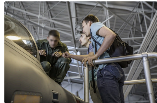
Le mécano (visage flouté volontairement) donne des explications