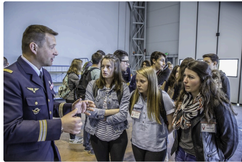
Le lieutenant-colonel pilote donne des explications