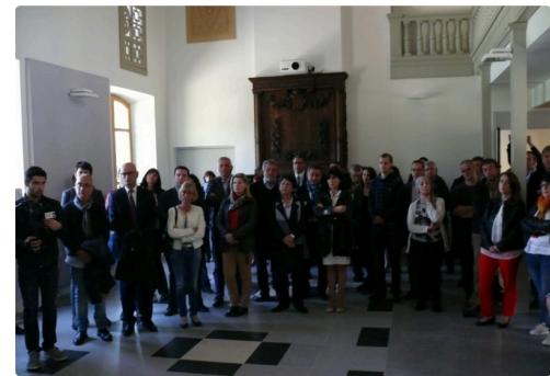
De nombreux Conseillers Départementaux étaient présents.