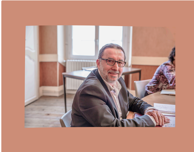
Des investissements vont métamorphoser le centre de Nogaro :

La rue Nationale, la place devant la cité scolaire etc.