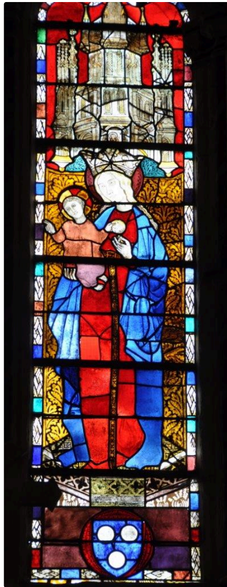
eglise vitraux vert 3.jpg