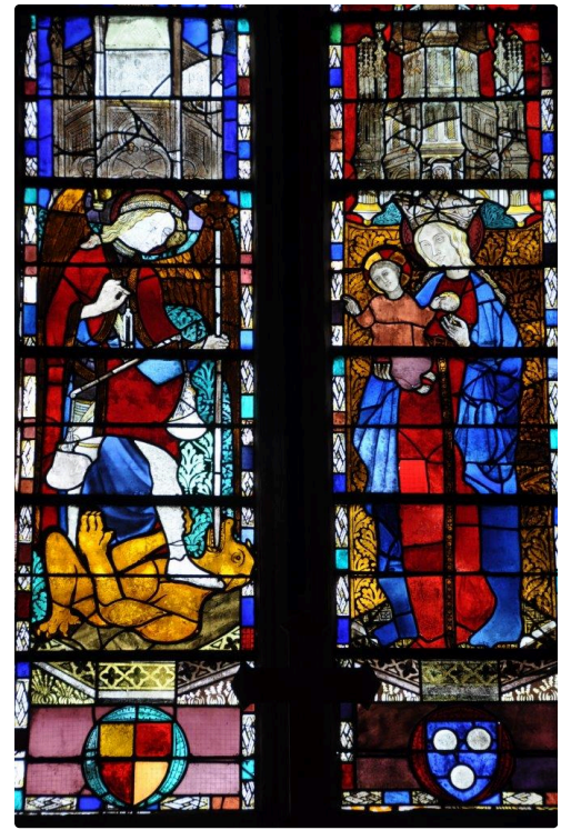
eglise vitraux verticaux 1.jpg